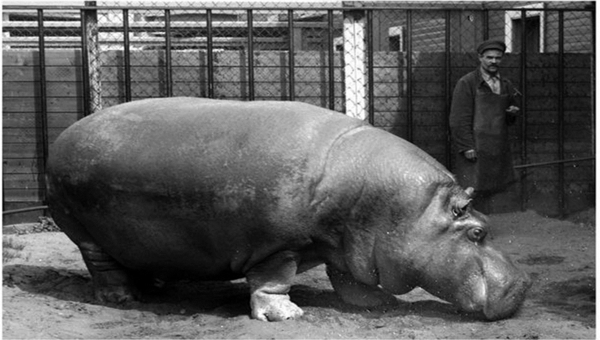
БЕГЕМОТ КРАСАВИЦА. 1935 ГОД.