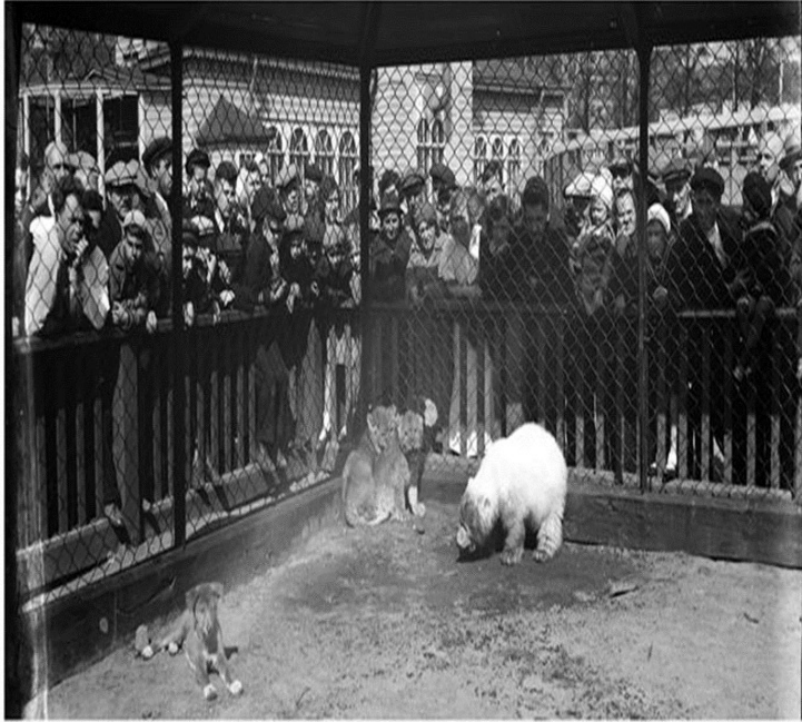
ПЛОЩАДКА МОЛОДНЯКА. 1930-е ГОДЫ.