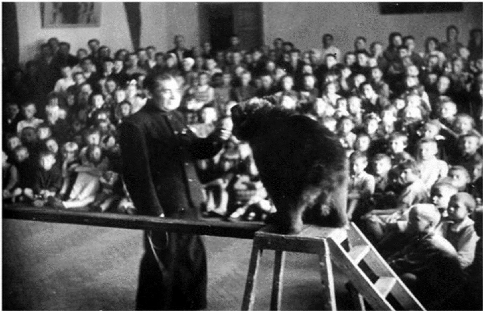
ВЫСТУПЛЕНИЕ ТЕАТРА ЗВЕРЕЙ В ДЕТСКОМ ДОМЕ. 1943 ГОД.