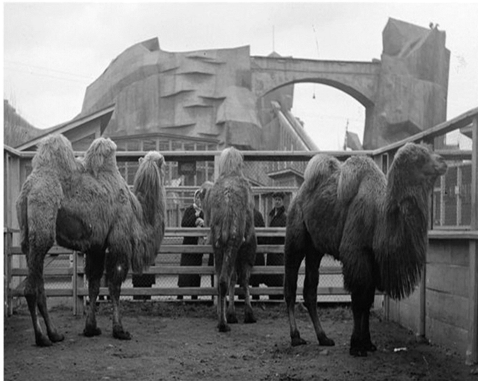
ГРУППА ВЕРБЛЮДОВ НА ФОНЕ АМЕРИКАНСКИХ ГОР. 1936 ГОД.