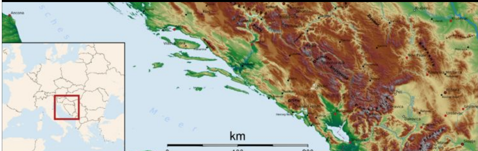
13. Pohorie na juhozápade Balkánskeho polostrova.