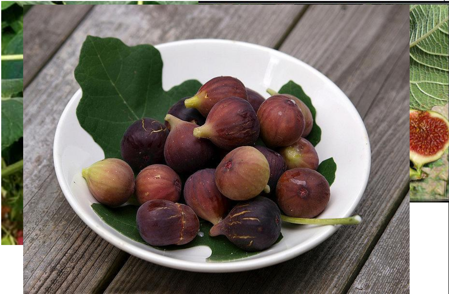
12. Plod stromu, ktorý pestujú v subtropickom podnebí v okolí Stredozemného mora.