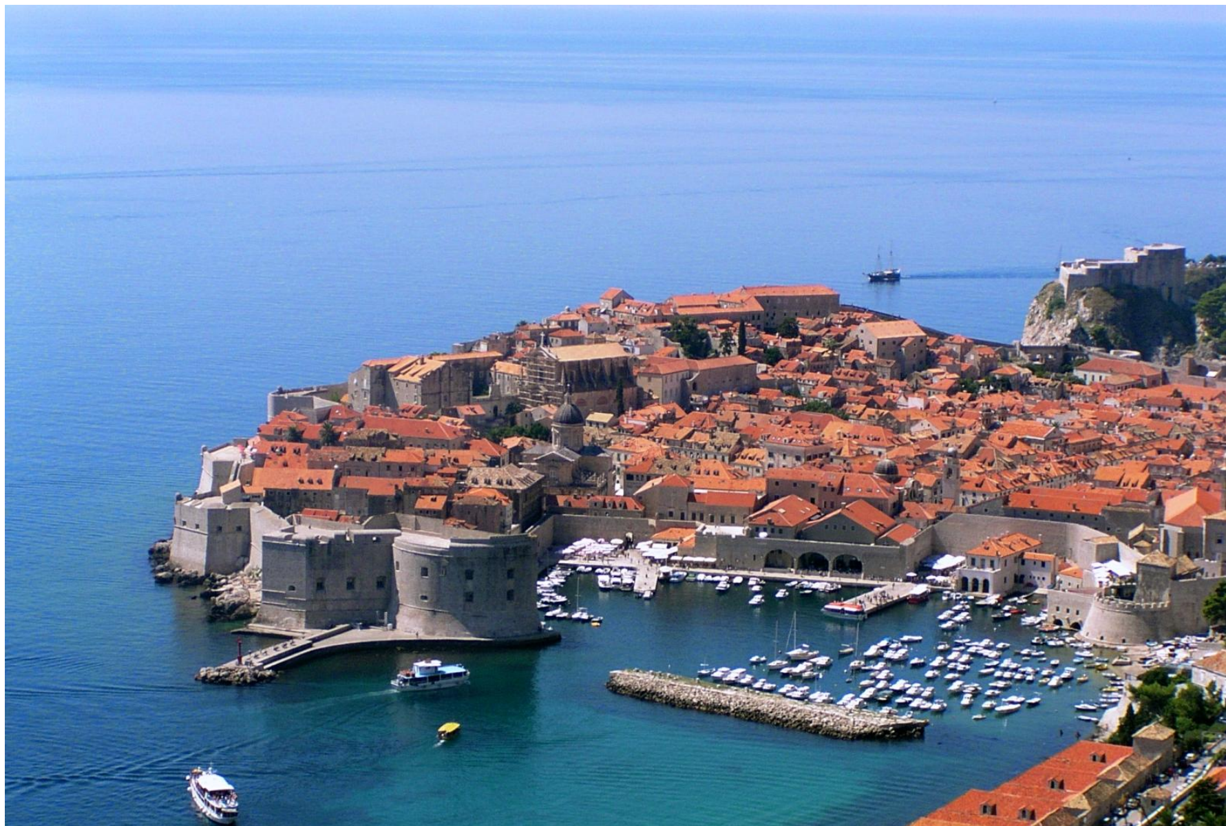
6. Mesto v Chorvatsku, perla Jadranu, obklojene hradbami, lokalita UNESCO.