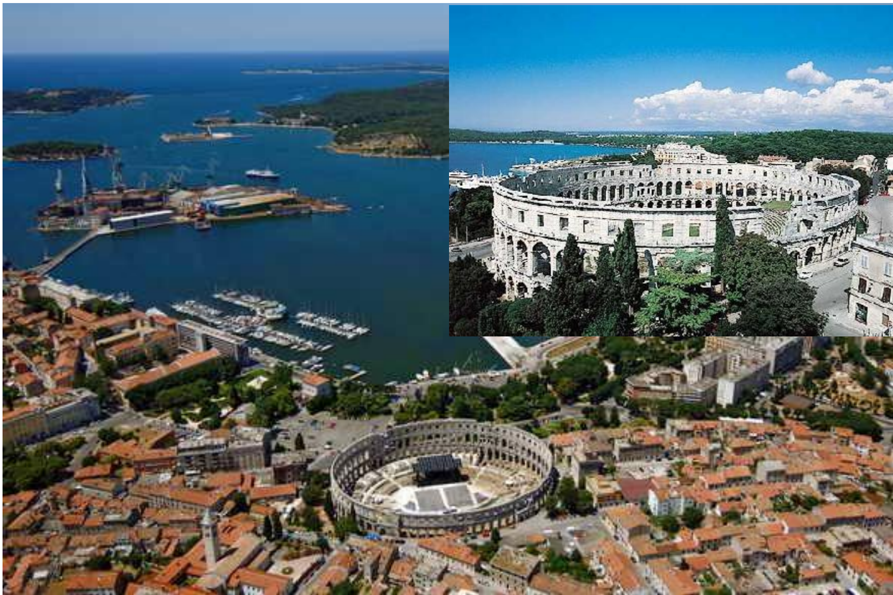
19. Chorvátske prímorské mesto na polostrove Istria, najvýznamnejšou pamiatkou je rímsky amfiteáter.