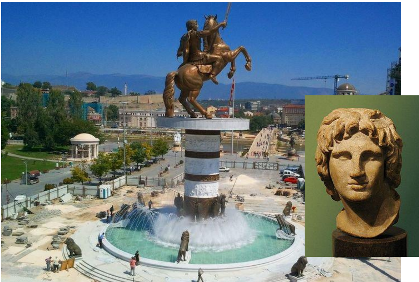
7. Významná osobnosť macedónskych a gréckych dejín, v Skopje má bronzovú sochu.