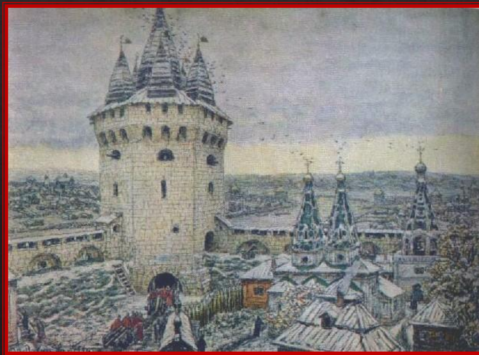
Семиверхая угловая башня Белого города (Худ. А. Васнецов)