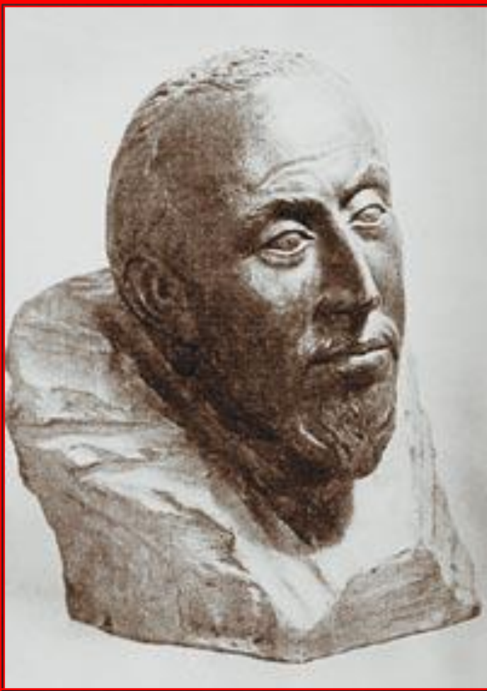
Царь Федор Иванович. Реконструкция по черепу М.М. Герасимова