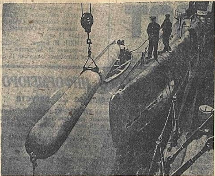
Черноморский флот. Подводная лодка готовится к боевому походу. Погрузка торпеды.

Смерть немецким оккупантам! КРАСНЫЙ ФЛОТ ОРГАН НАРОДНОГО КОМИССАРИАТА ВОЕННО-МОРСКОГО ФЛОТА № 197 (1456) 21 августа 1943 г., суббота ЦЕНА 20 КОП.