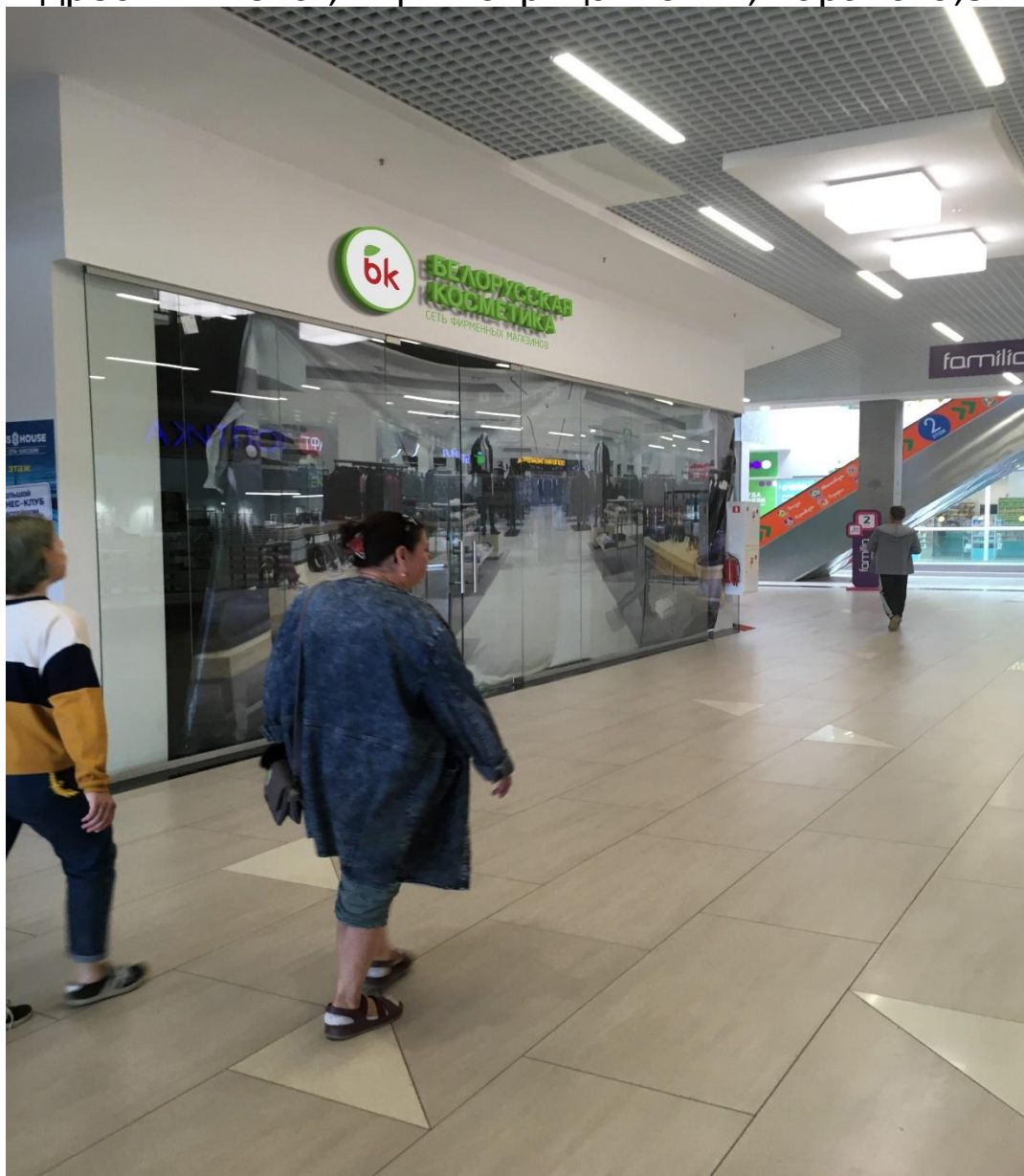
Фото потенциального МБК Адрес: г. Ижевск, ТЦ «Матрица Молл», Баранова,87