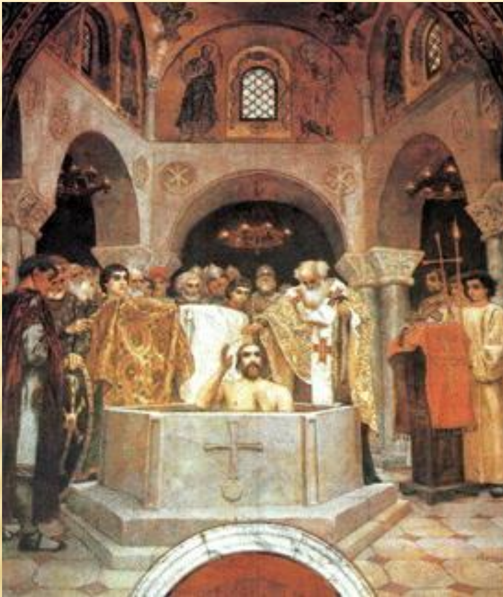
Крещение князя Владимира в Корсуни в 988 году