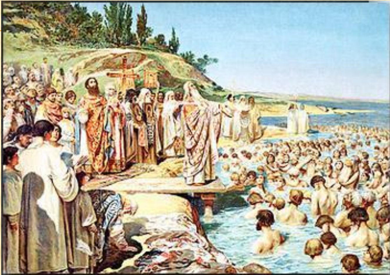
К.В.Лебедев . Крещение киевлян.