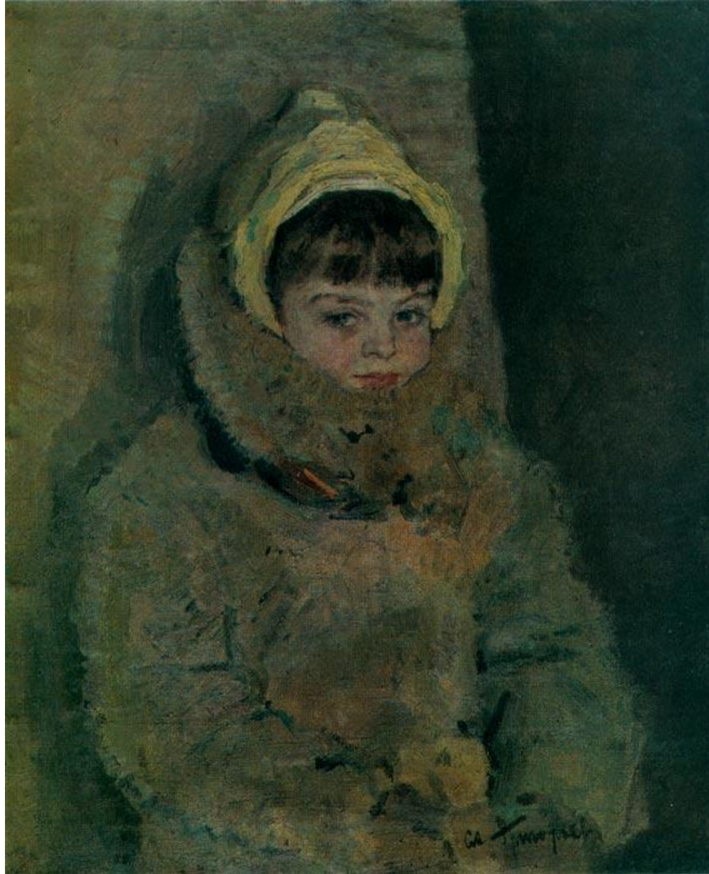
«Девочка в шубе»