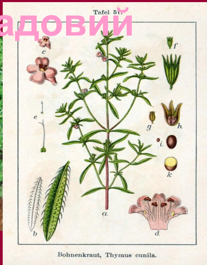
Bohnenkraut, Thymus cunila .