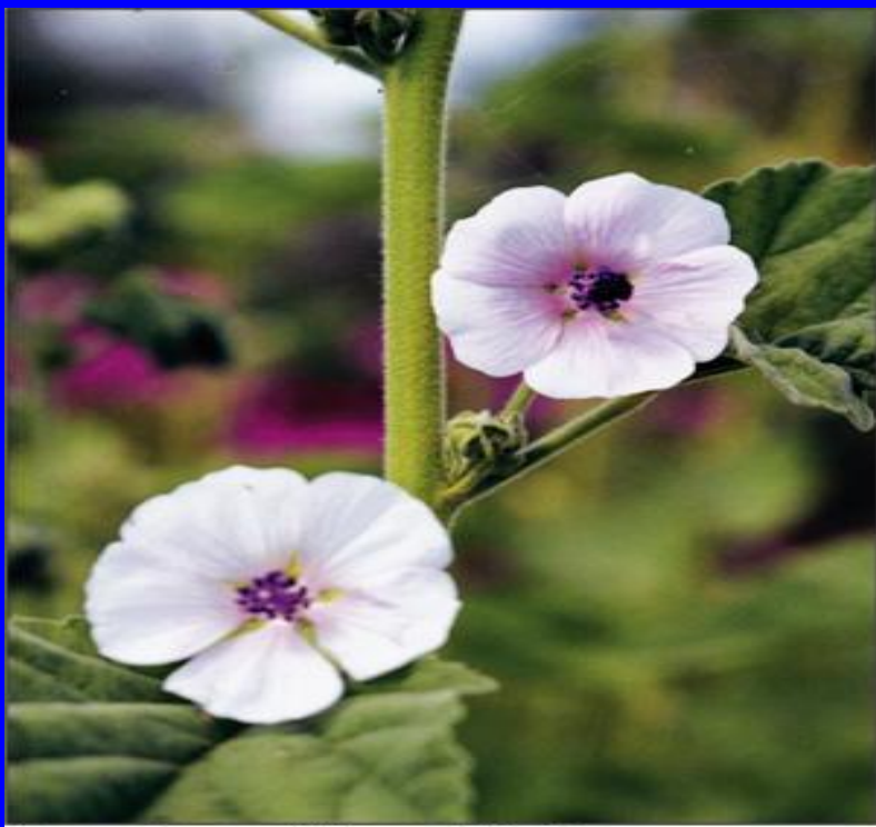
Алтея лікарська/ Althaea officinalis