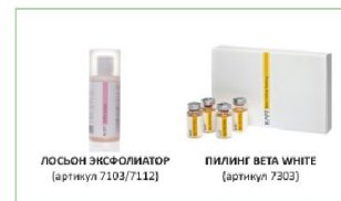
ЛОСЬОН ЭКСФОЛИАТОР (артикул 7103/7112)