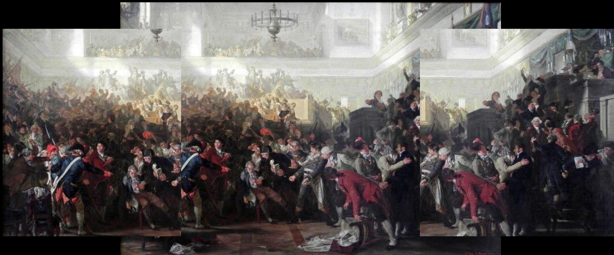
СВЕРЖЕНИЕ РОБЕСПЬЕРА В НАЦИОНАЛЬНОМ КОНВЕНТЕ 27 ИЮЛЯ 1794 ГОДА. КАРТИНА МАКСА АДАМО. 1870 ГОД