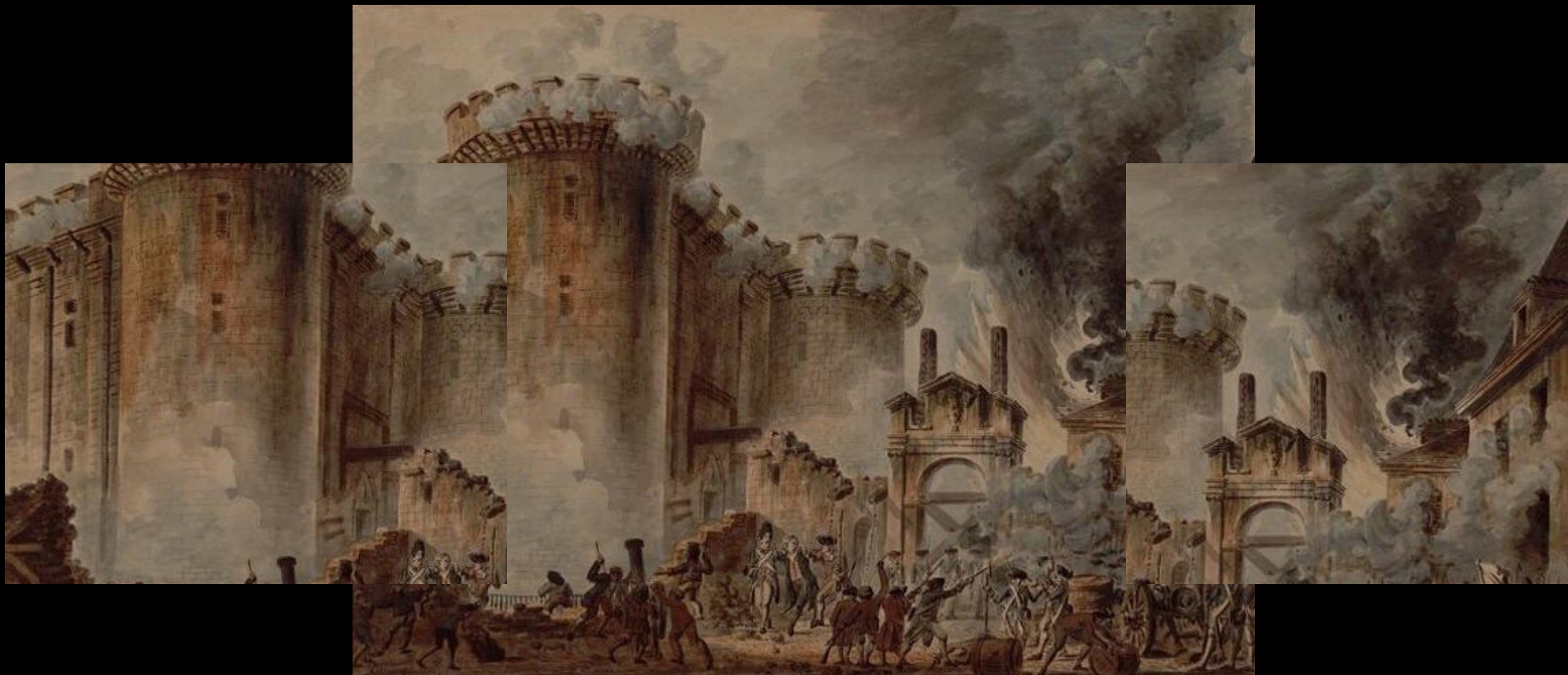
ВЗЯТИЕ БАСТИЛИИ 14 ИЮЛЯ 1789 ГОДА. КАРТИНА ЖАНА ПЬЕРА УЭЛЯ. 1789 ГОД