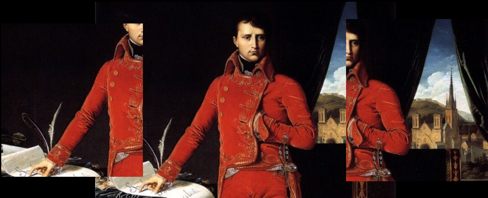
ПОРТРЕТ НАПОЛЕОНА БОНАПАРТА, ПЕРВОГО КОНСУЛА. ФРАГМЕНТ КАРТИНЫ ЖАНА ОГЮСТА ДОМИНИКА ЭНГРА. 1803–1804 ГОДЫ