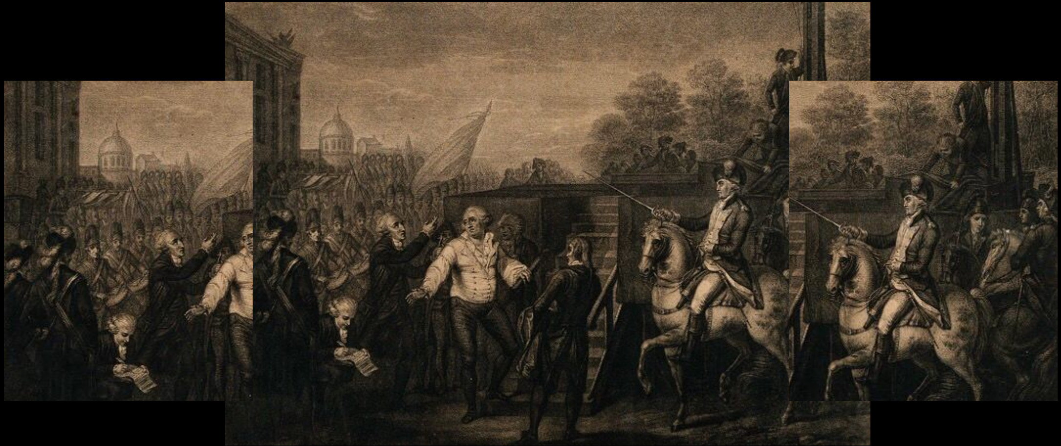
ПОСЛЕДНИЕ МГНОВЕНИЯ ЖИЗНИ ЛЮДОВИКА XVI. ГРАВЮРА ПО КАРТИНЕ ЧАРЛЬЗА БЕНАЗЕЧА. 1793 ГОД