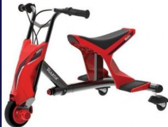
Razor Drift Rider