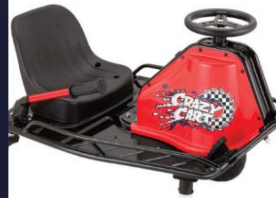
Crazy Cart XL