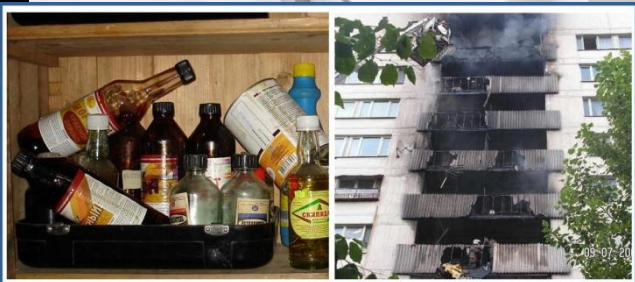
Беспечность при хранении легковоспламеняющихся жидкостей может привести к трагедии

✓ Любую беду проще предотвратить, нежели устранить. Профилактика пожаров в общественных местах выглядит следующим образом: Помещение обязательно должно быть оснащено нужным количеством огнетушителей.