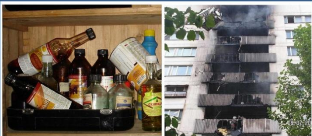
Беспечность при хранении легковоспламеняющихся жидкостей может привести к трагедии

✓ Любую беду проще предотвратить, нежели устранить. Профилактика пожаров в общественных местах выглядит следующим образом: Помещение обязательно должно быть оснащено нужным количеством огнетушителей.