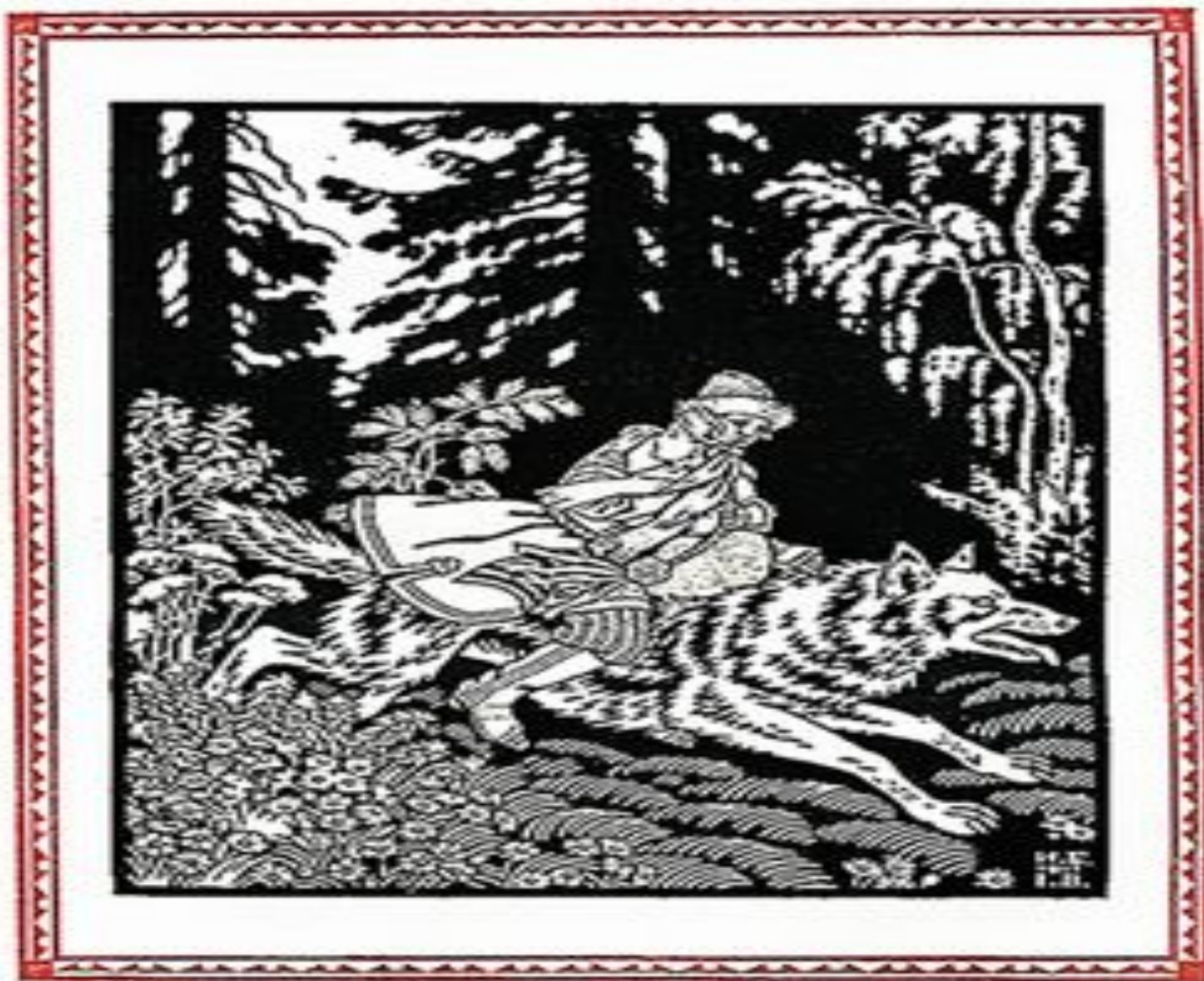
И.Я. Билибин. Иллюстрация к « Сказке об Иване- царевиче, жар-птице и сером волке»