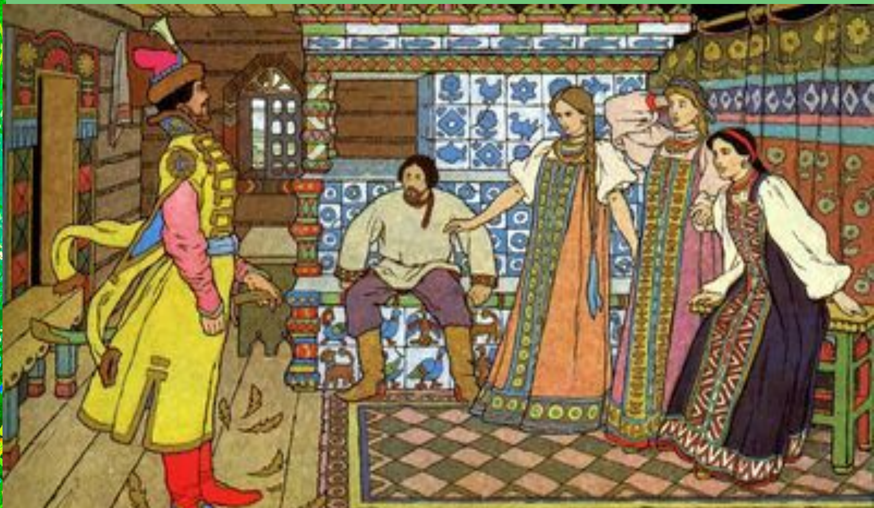
И.Я.Билибин . Иллюстрация к сказке «Марья Моревна»