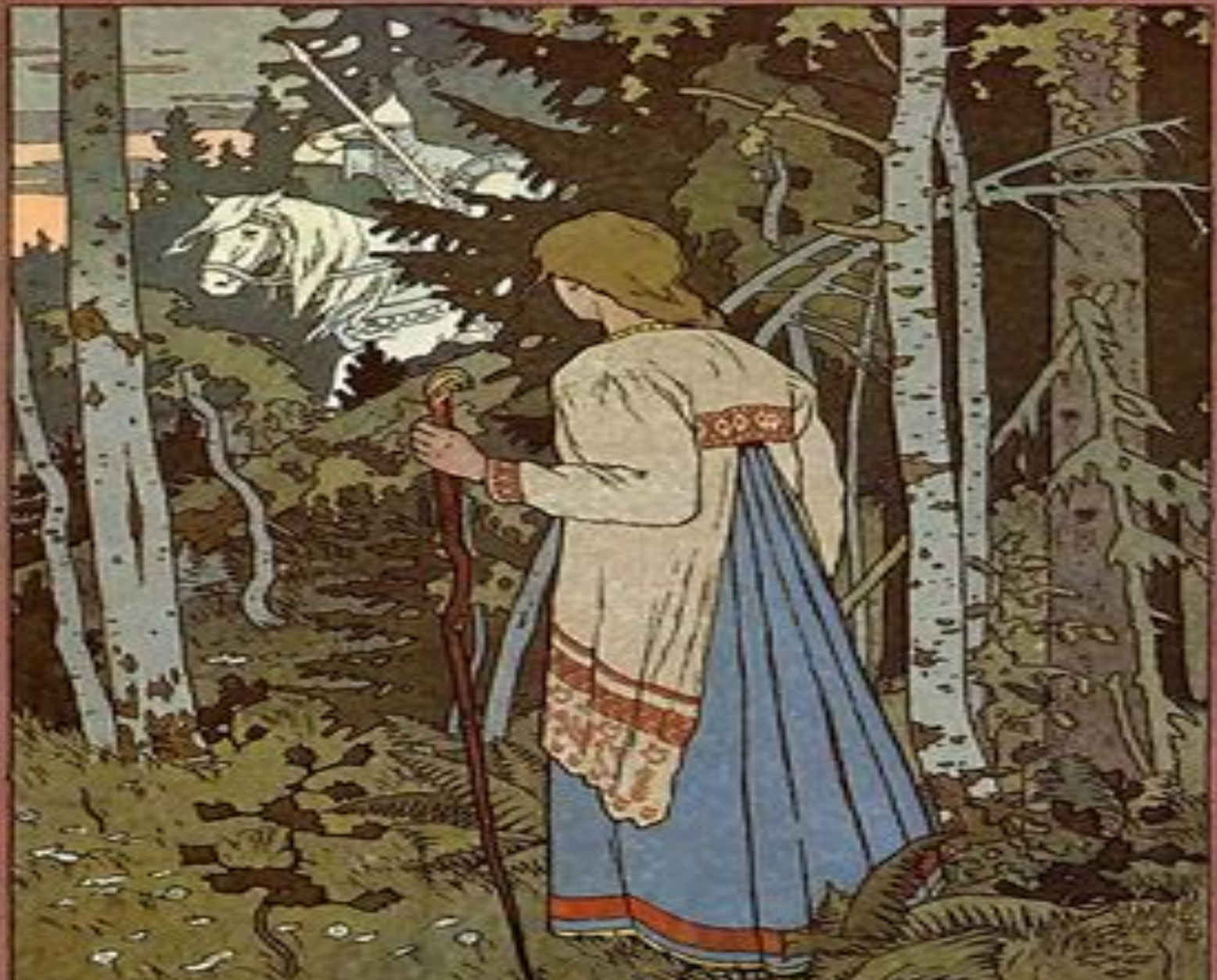
И.Я. Билибин . Иллюстрация к сказке «Василиса Прекрасная»