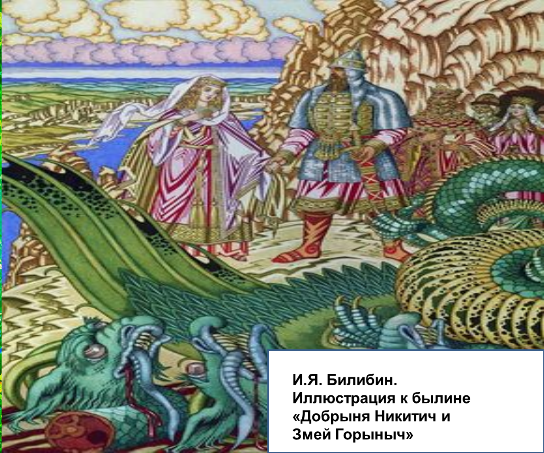
И.Я. Билибин. Иллюстрация к былине «Добрыня Никитич и Змей Горыныч»