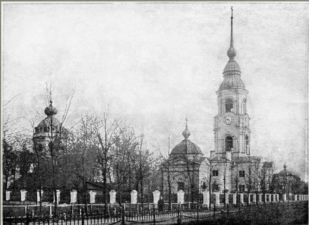
КЪ 200-ЛѢТІЮ КОЛПИНСКОЙ ЧУДОТВОРНОЙ ИКОНЫ. Троицкій соборъ въ Колпинѣ, гдѣ въ настоящее время находится икона.

В течение почти двухсот лет являлась композиционным центром Колпина и его главной архитектурной доминантой. Строительство пятиглавой каменной церкви в стиле барокко началось в 1758 г. и велось пятнадцать лет, освящение состоялось в 1773 г.