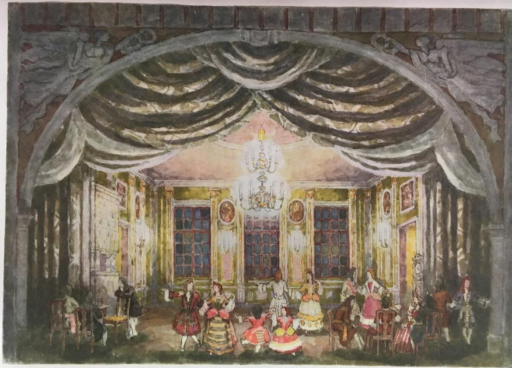
Эскиз декорации к опере П.И. Чайковского «Пиковая дама»