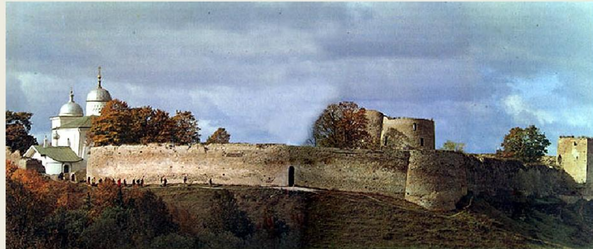
Крепость Изборск 1330г.

Своеобразием отличалось зодчество Пскова