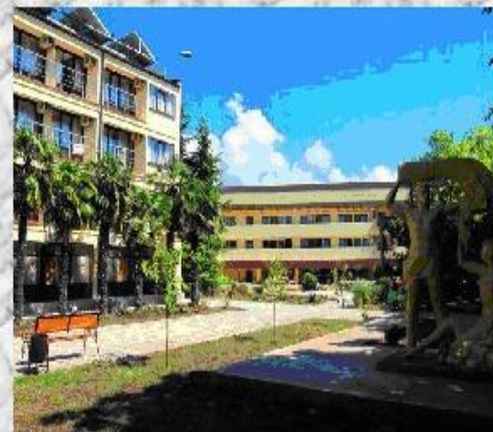
Санаторий «Золотой колос» Алушта