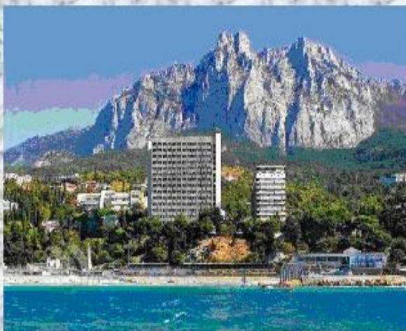
Санаторий «Ай-Петри» Ялта, Мисхор

Рекреационный комплекс Крыма в основном представлен предприятиями специализирующихся на лечении - здравницы, санатории. В Крыму насчитывается около 800 рекреационных предприятий (здравниц) емкостью более 200 тыс. мест, 40% из них круглогодичного функционирования.