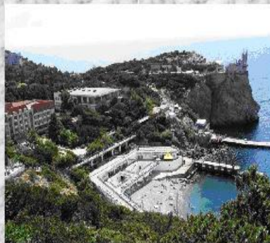
Санаторий «Жемчужина» Ялта, Гаспра