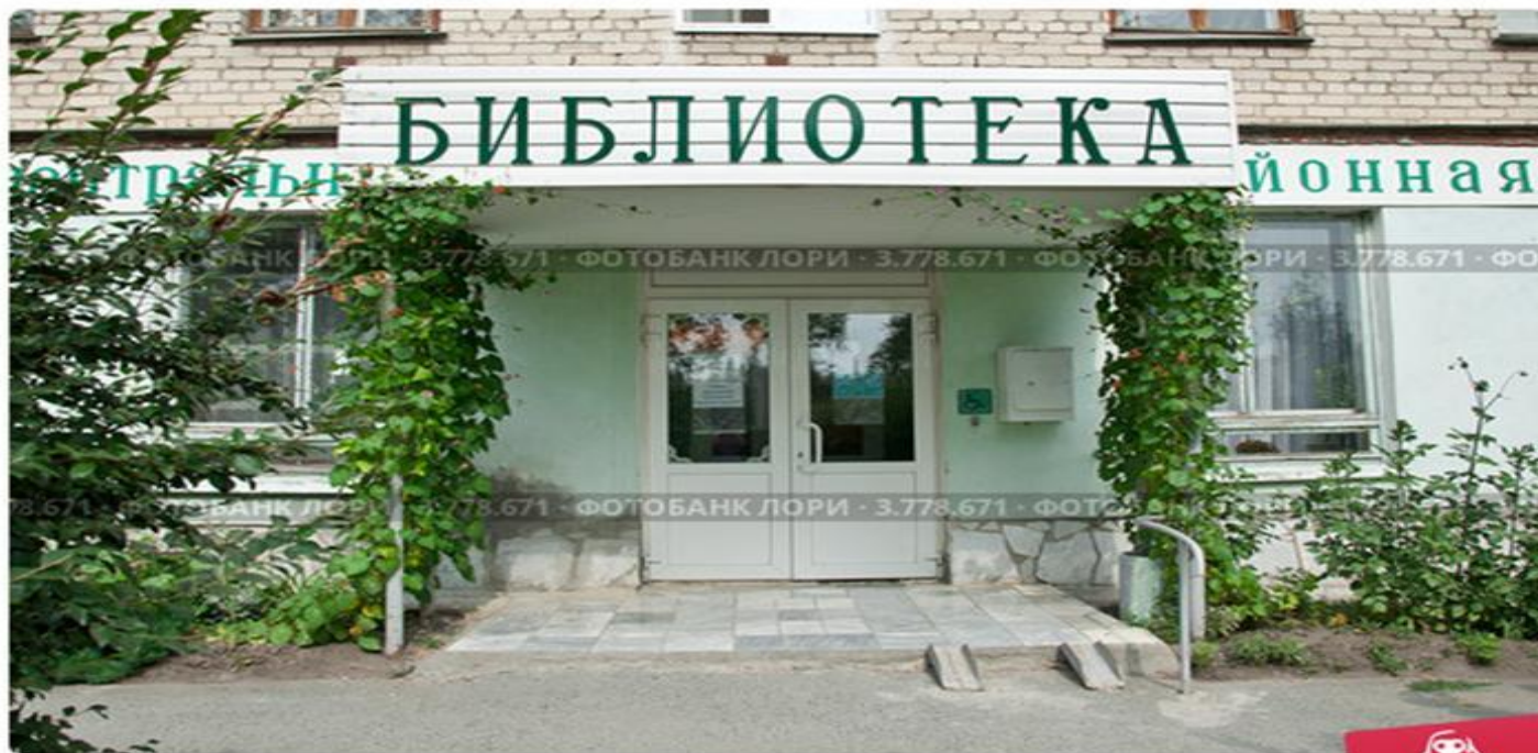
Центральная районная библиотека. Россия, Свердловская область, город