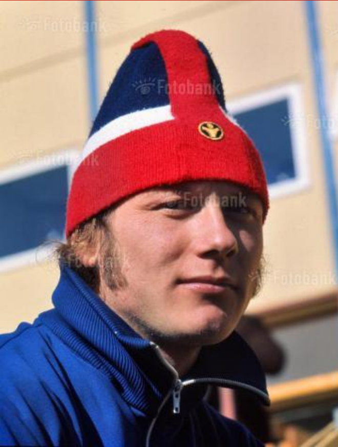
FB31-3366 Чемпион Олимпийских Игр в конькобежном спорте Евгений Куликов, 1976.