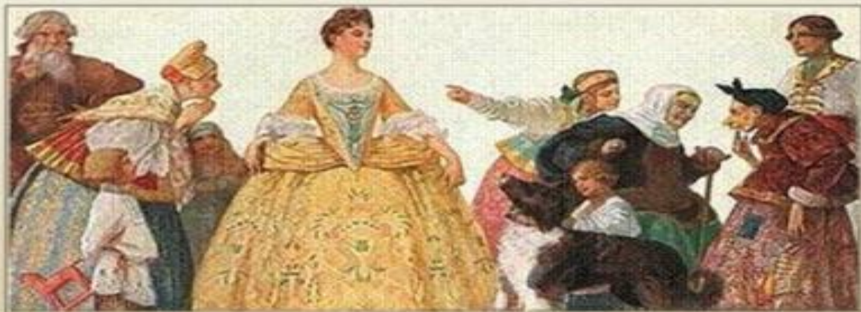
«Эко чучела!», иллюстрация С. С. Соломко

При отсутствии денег – укорачивали ножницами прямо на улице.