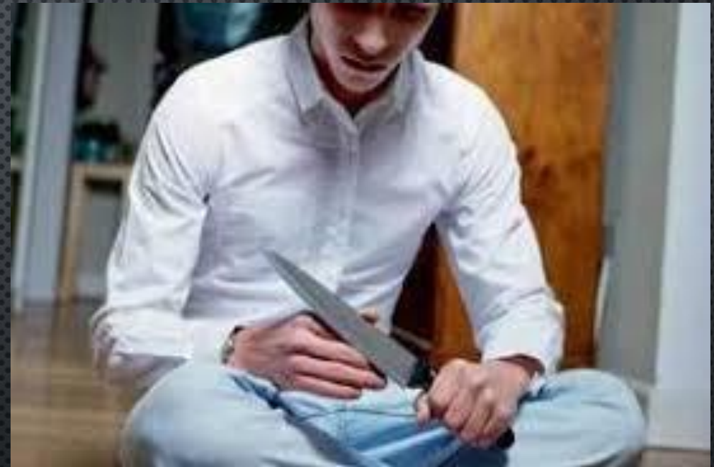
Депрессия с аутоагрессивными тенденциями