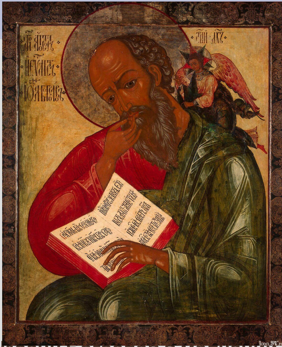
ИОАНН БОГОСЛОВЪ В МОЛЧАНИИ