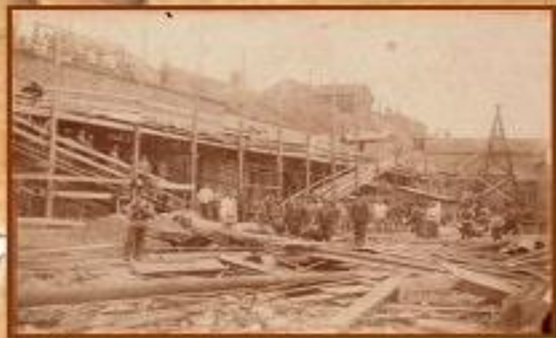
Строительство писчебумажной фабрики «Сокол». 1897 г.