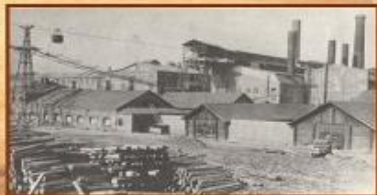
Здание электроцеха 1928 г.