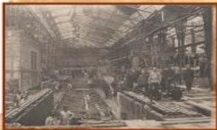
Монтаж новой БДМ 1927 г.