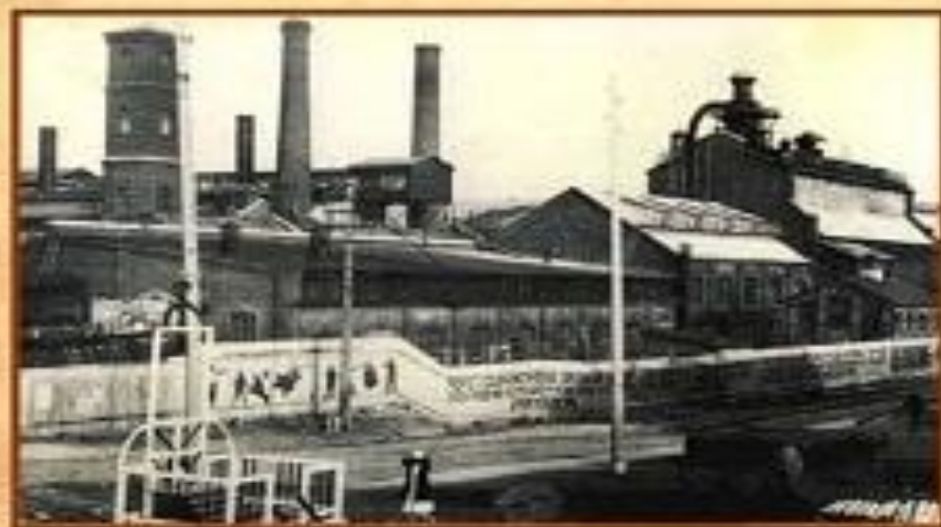
Фабрика «Сокол», 1930 г.