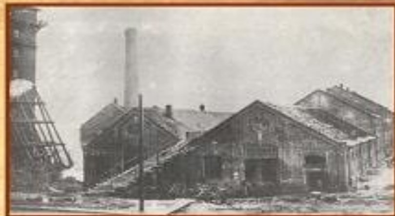
Фабрика «Сокол», 1900 г.