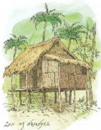
Дом из бамбука