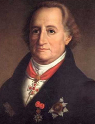
Иоганн Вольфганг Гёте