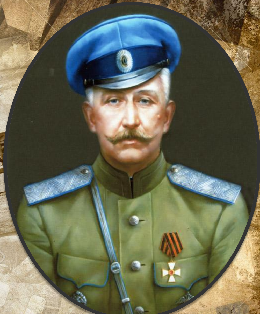
Пётр Никола́евич Красно́в (1869г.-1947г.) генерал Русской императорской армии, атаман Всевеликого Войска Донского, военный и политический деятель