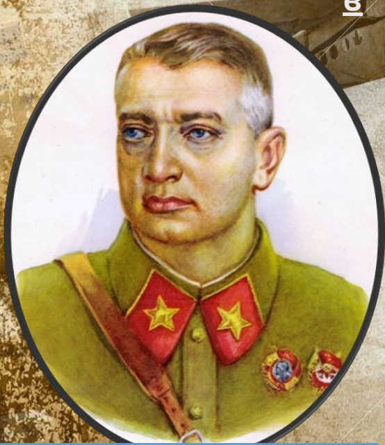
Михаи́л Никола́евич Тухаче́вский

❖ Против Польши были брошены практически все силы Красной Армии, объединившиеся в составе Западного и Юго-Западного фронтов. Ими командовали бывшие офицеры царской армии М. Н. Тухачевский и А. И. Егоров . 12 июня был освобожден Киев. Наступление развивалось стремительно. У части большевистских лидеров зародилась надежда на успех революции в Западной Европе. Однако вступившая на польскую территорию Красная Армия встретила яростный отпор от противника, который получил большую помощь со стороны Антанты. Из-за несогласованности действий соединений РККА фронт Тухачевского был разгромлен. Неудача постигла и Юго-Западный фронт. 12 октября 1920 г. в Риге были заключены предварительные условия, а 18 марта 1921 г. там же подписан мирный договор с Польшей , по которому Польше