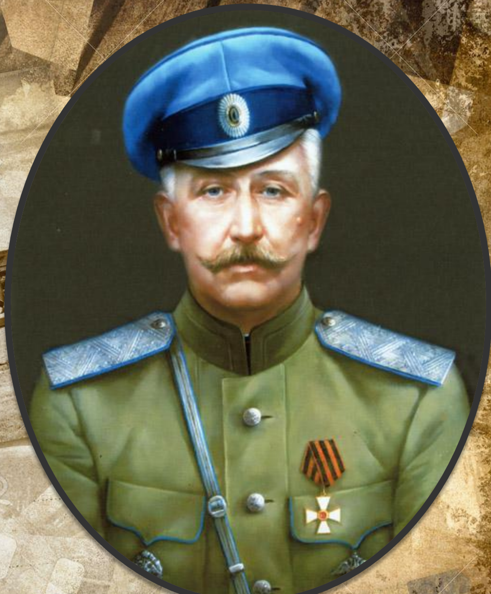
Пётр Никола́евич Красно́в (1869г.-1947г.) генерал Русской императорской армии, атаман Всевеликого Войска Донского, военный и политический деятель