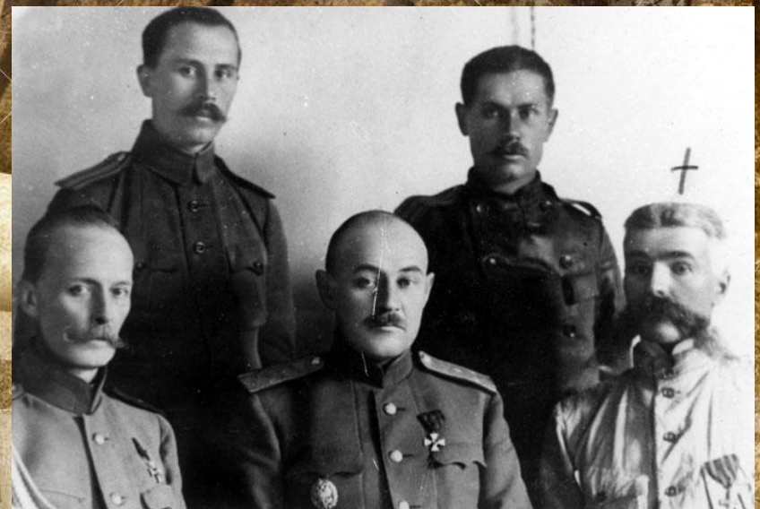
Командование Донской армии

Вторым центром сопротивления советской власти стал Юг России. Весной 1918 г. Дон заполнили слухи о предстоящем уравнительном разделе земель. Казачество зароптало. Вспыхнуло восстание казаков. Оно совпало с приходом на Дон немцев. Казачьи верхи вступили с недавним противником в переговоры. 21 апреля было создано Временное донское правительство , которое приступило к формированию Донской армии (под руководством П. Н. Краснова) наделив его почти диктаторскими полномочиями. Опираясь на немецкую поддержку, Краснов жестокими методами провел массовые мобилизации, доведя к середине июля 1918 г. численность Донской армии до 45 тыс. человек. Вооружение в избытке поставлялось Германией. К середине августа части Краснова заняли всю Донскую область и совместно с германскими войсками развернули военные действия против Красной Армии.