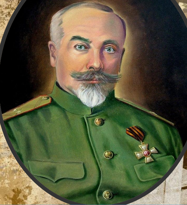
Антóн Ива́нович Дени́кин (1872г. – 1974г.) русский военачальник, политический и общественный деятель, писатель, мемуарист, публицист и военный документалист.

В начале ноября 1918 г. мировая война закончилась поражением Германии и ее союзников. Под давлением и при активной помощи стран Антанты в конце 1918 г. все антибольшевистские Вооруженные силы Юга России были объединены под командованием Деникина . Его армия в мае-июне 1919 г. перешла в наступление по всему фронту, захватила Донбасс, часть Украины, Белгород, Царицын. В июле началось наступление на Москву, белые заняли Курск, Орел, Воронеж. На советской территории началась очередная волна мобилизации сил и средств под девизом « Все на борьбу с Деникиным! ». В октябре 1919 г. Красная Армия перешла в контрнаступление. В феврале–марте 1920 г. основные силы деникинцев на Северном Кавказе были разбиты, и Добровольческая армия перестала существовать. В начале апреля 1920 г. главнокомандующим войсками в Крыму был назначен генерал П. И. В.