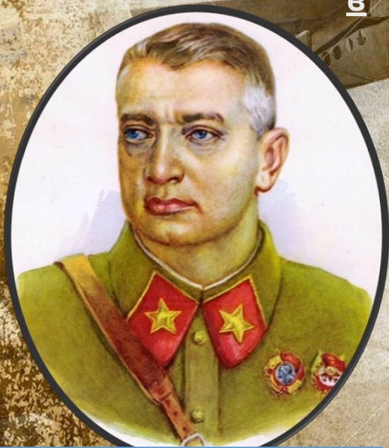
Михаи́л Никола́евич Тухаче́вский

❖ Против Польши были брошены практически все силы Красной Армии, объединившиеся в составе Западного и Юго-Западного фронтов. Ими командовали бывшие офицеры царской армии М. Н. Тухачевский и А. И. Егоров . 12 июня был освобожден Киев. Наступление развивалось стремительно. У части большевистских лидеров зародилась надежда на успех революции в Западной Европе. Однако вступившая на польскую территорию Красная Армия встретила яростный отпор от противника, который получил большую помощь со стороны Антанты. Из-за несогласованности действий соединений РККА фронт Тухачевского был разгромлен. Неудача постигла и Юго-Западный фронт. 12 октября 1920 г. в Риге были заключены предварительные условия, а 18 марта 1921 г. там же подписан мирный договор с Польшей , по которому Польше