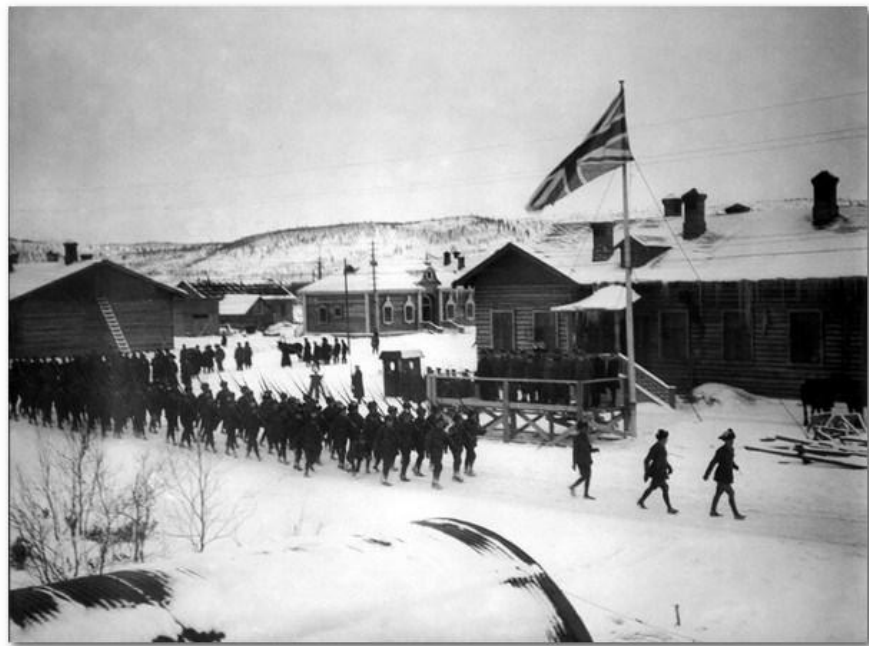
Английские войска в Мурманске

В апреле 1918 г. японские десантники высадились во Владивостоке. К ним присоединились английские, американские, французские и другие войска. Правительства стран Антанты не объявляли войну Советской России, более того, они прикрывались идеей выполнения «союзнического долга». В январе 1919 г. были высажены десанты в Одессе, Крыму, Баку, Батуми и увеличено количество войск на Севере и Дальнем Востоке. Но недовольство личного состава экспедиционных войск заставило эвакуировать черноморский и каспийский десанты уже весной 1919 г. Англичане покинули Архангельск и Мурманск осенью 1919 г. В 1920 г. эвакуировались с Дальнего Востока английские и американские части. Только японские войска оставались