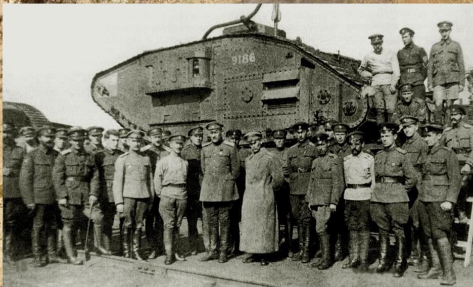
Танк в Донской армии