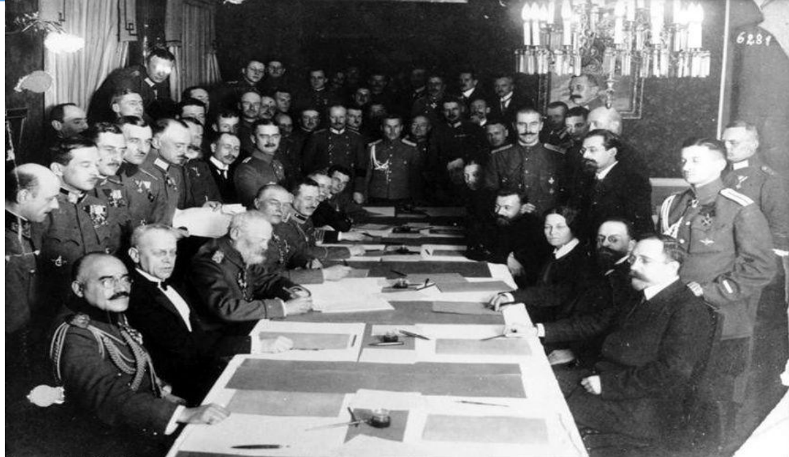
Заключение Брестского мирного договора

Украины и в марте 1918 г. вернулось в Киев вместе с австро-германскими