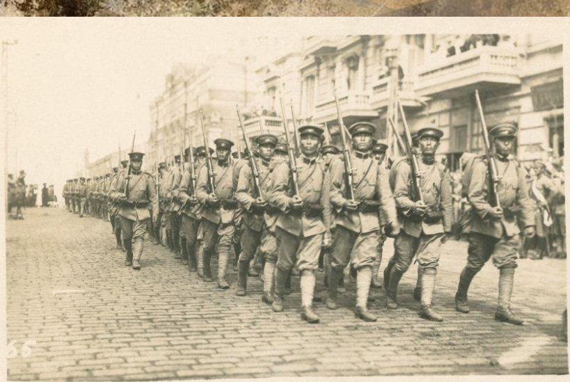
Японские солдаты на Дальнем