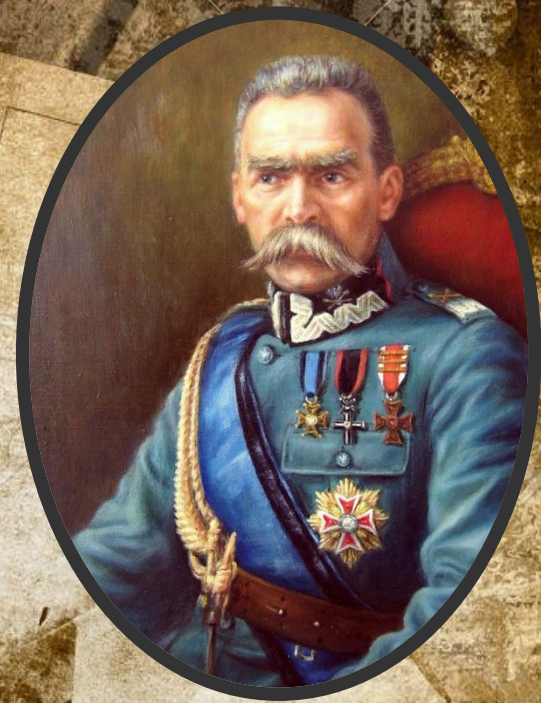
Юзеф Кле́менс Пилсудский

В апреле 1920 г. глава Польши Ю. Пилсудский отдал приказ о наступлении на Киев. Официально было объявлено, что речь идет об оказании помощи украинскому народу в ликвидации незаконной советской власти и восстановлении независимости Украины. В ночь на 7 мая Киев был взят. Однако вмешательство поляков население Украины восприняло как оккупацию. Большевики перед лицом внешней опасности сумели сплотить различные слои общества.