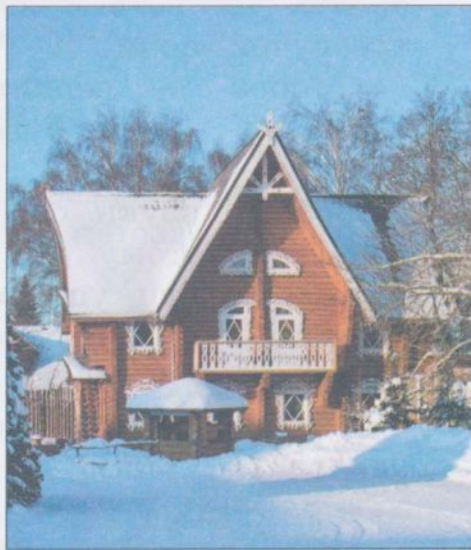
«Терем Снегурочки» в Костроме