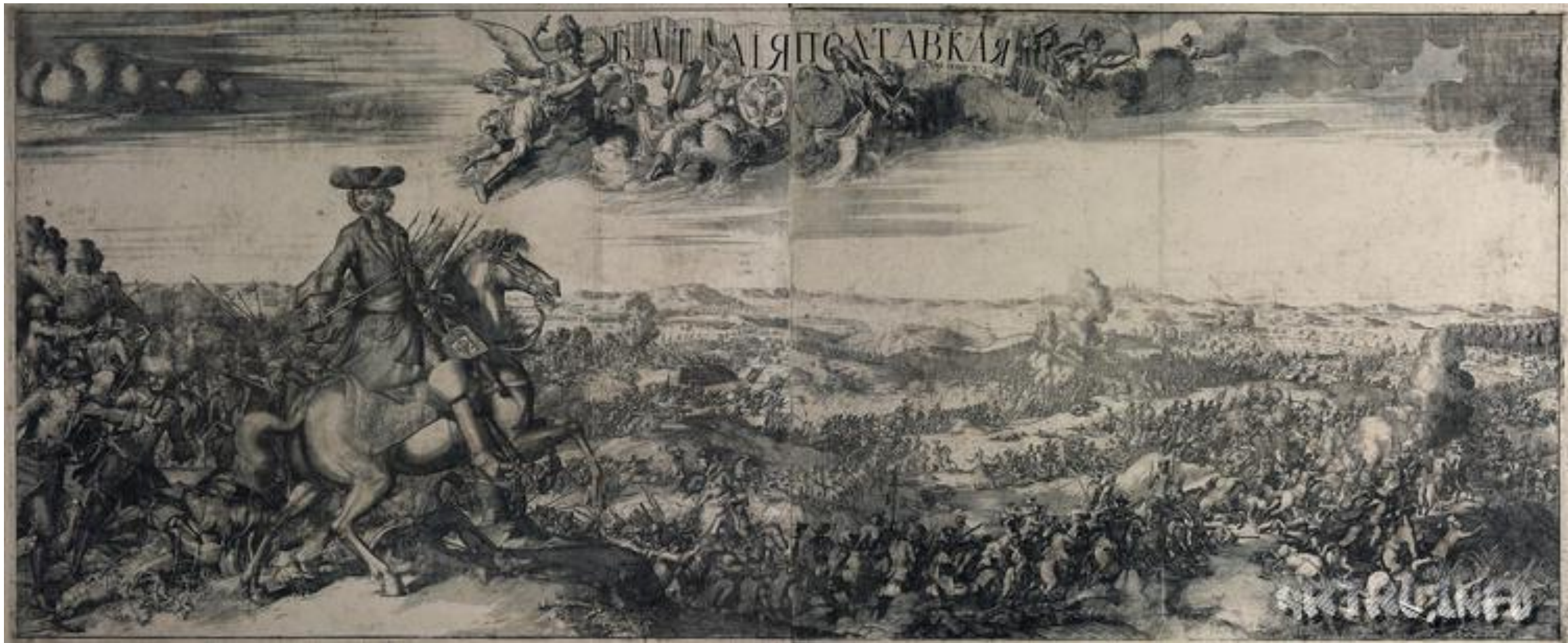
Алексей Зубов, Питер Пикарт. Баталия Полтавская 1715.