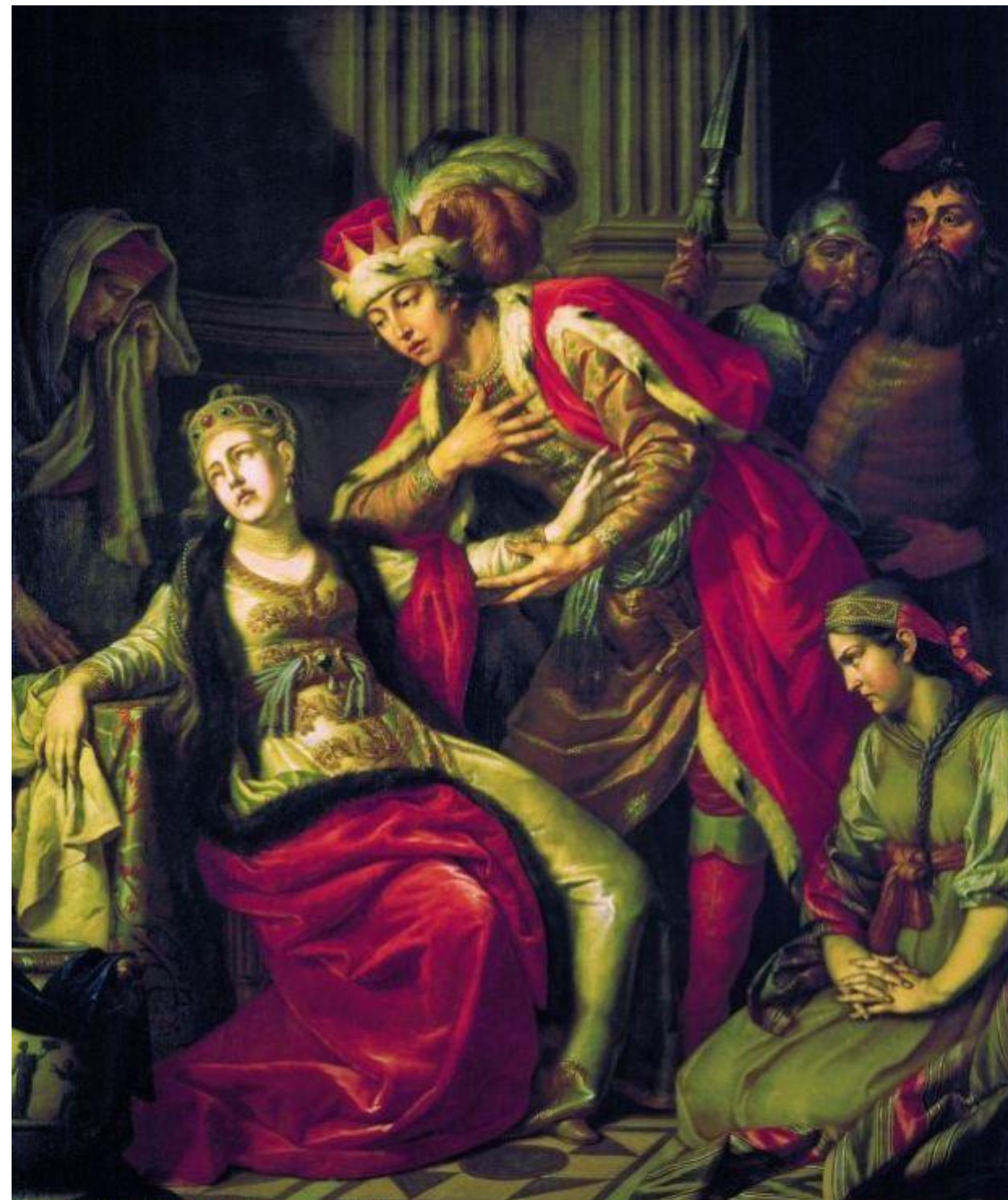
Антон Лосенко. Владимир и Рогнеда. 1770