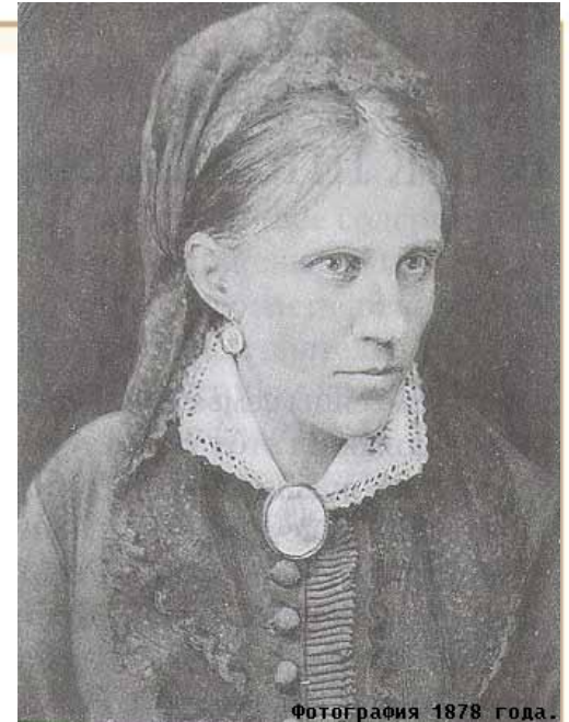
Фотография 1878 года.