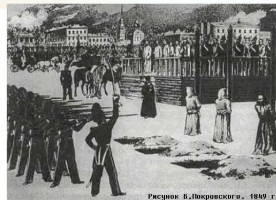
Рисунок Б.Покровского. 1849 г.