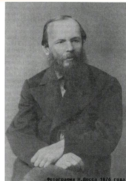
Фотография Н.Досса 1876 года.