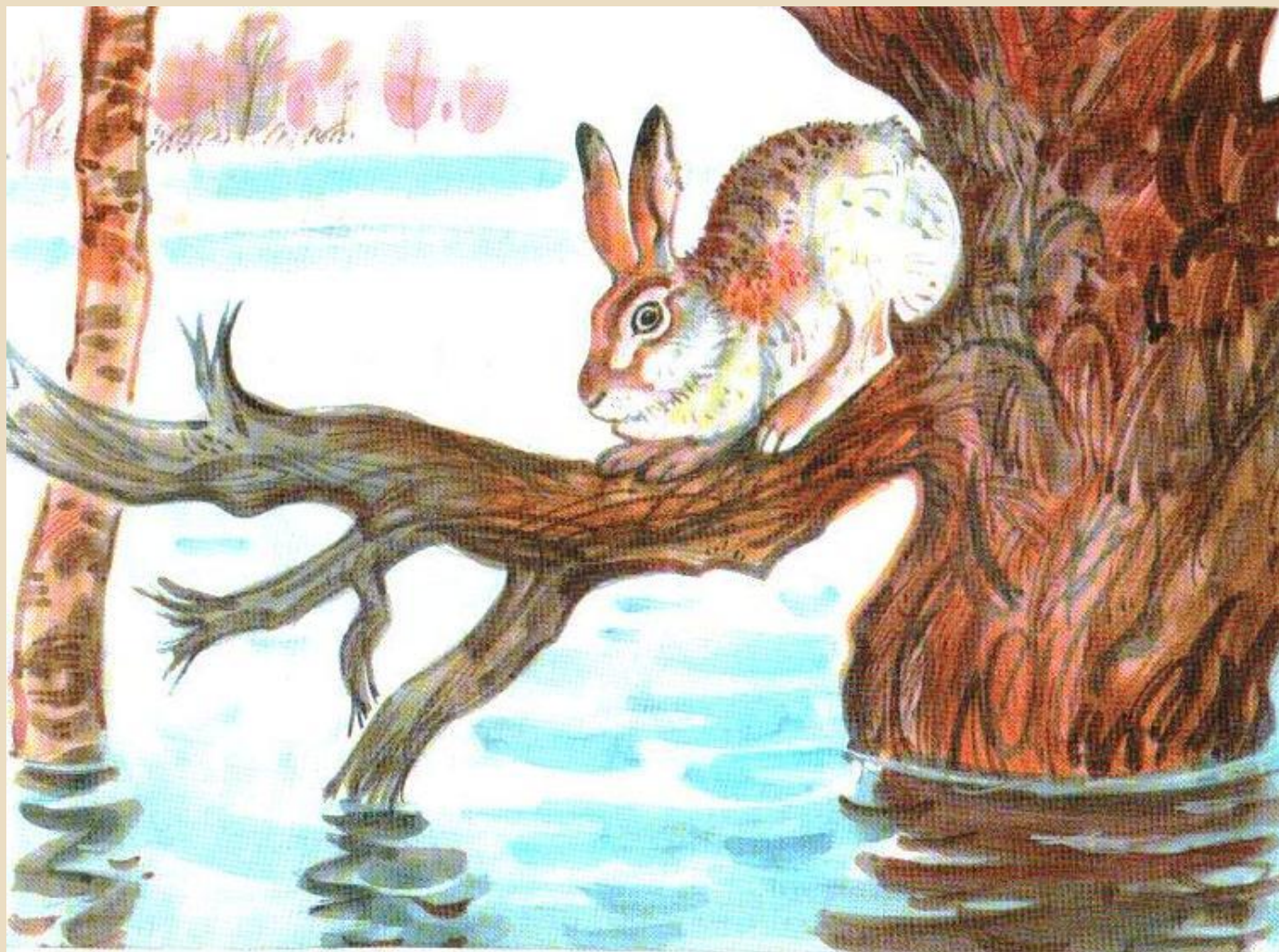
Картина А.Н.Комарова «Наводнение»