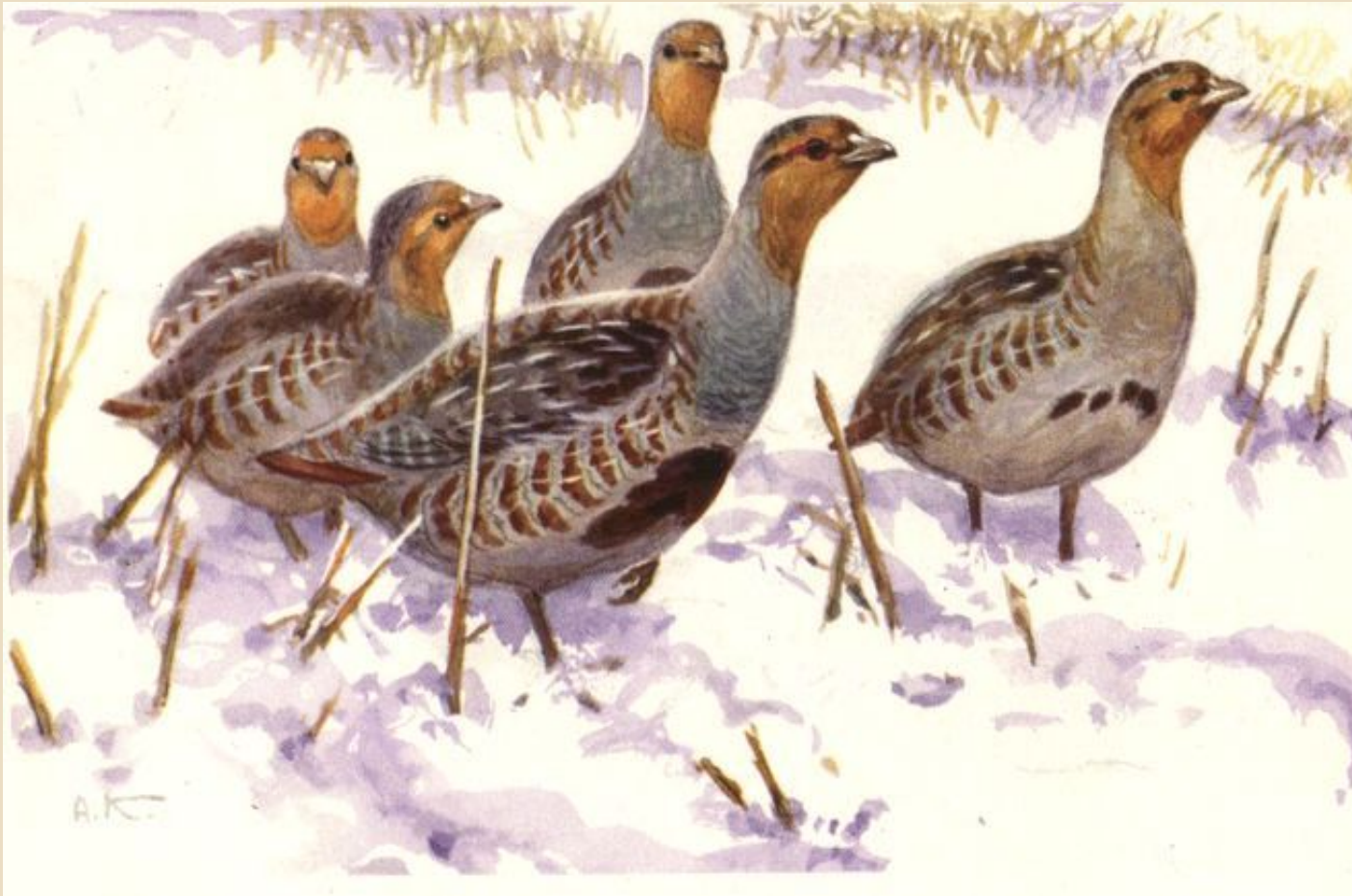
Художник А.Н. Комаров «Тревога»