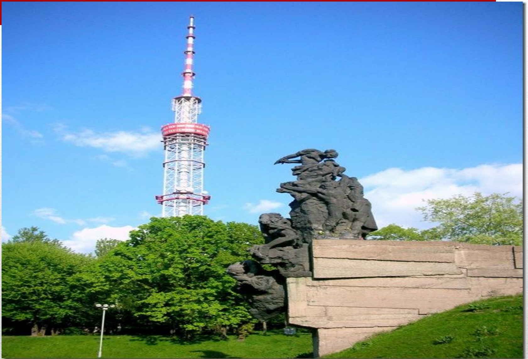
Памятник Бабьему Яру (Киев)