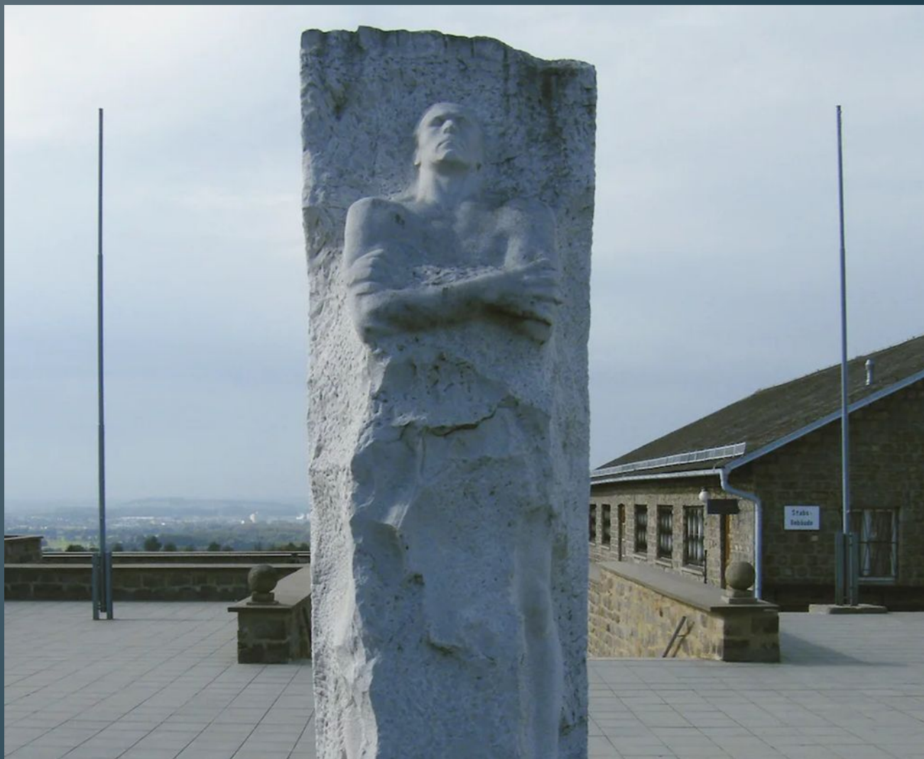
Монумент Карбышеву в Маутхаузене