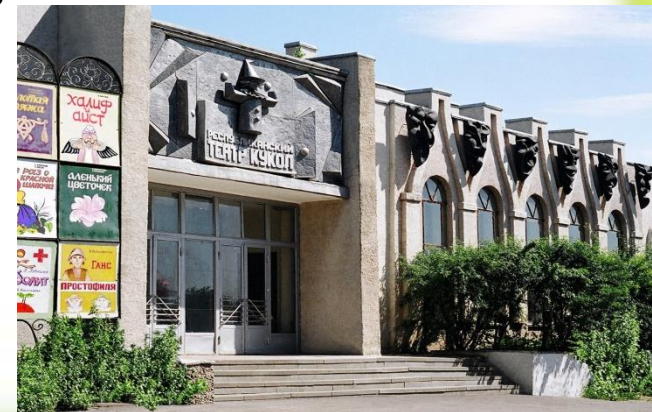
ГОСУДАРСТВЕННЫЙ ТЕАТР КУКОЛ РЕСПУБЛИКИ МОРДОВИЯ