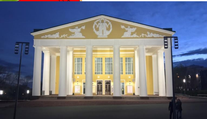
РУССКИЙ ДРАМАТИЧЕСКИЙ ТЕАТР РЕСПУБЛИКИ МОРДОВИЯ

Посмотри на картинки и вспомни названия театров Мордовии