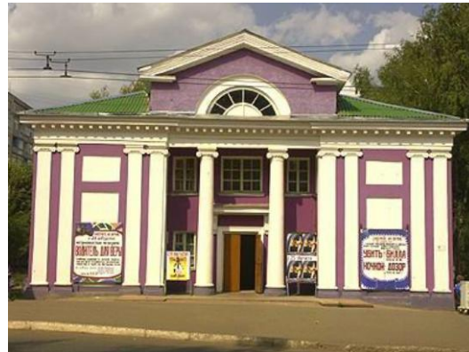
ГОРОДСКОЙ ДЕТСКИЙ ЦЕНТР ТЕАТРА И КИНО «КРОШКА»