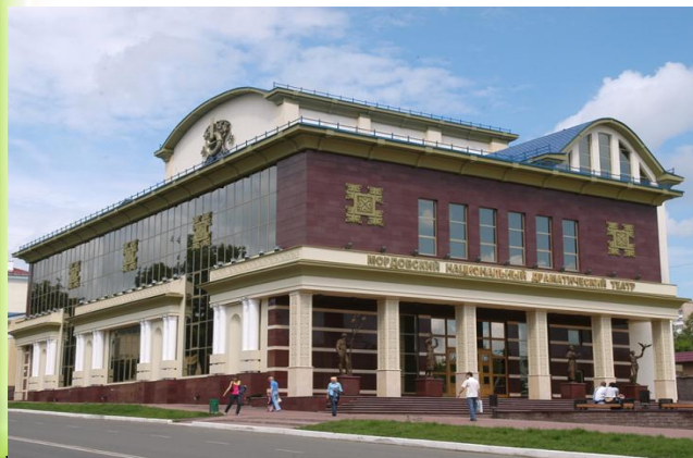
МОРДОВСКИЙ НАЦИОНАЛЬНЫЙ ДРАМАТИЧЕСКИЙ ТЕАТР