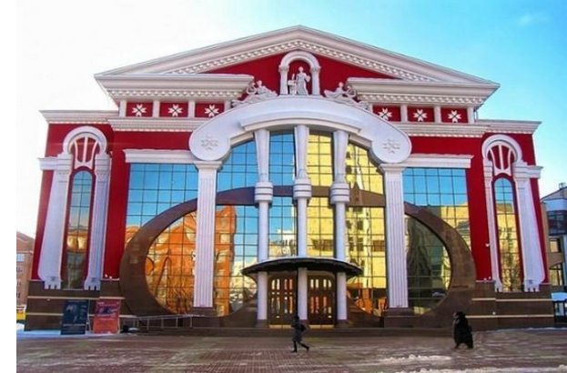
ГОСУДАРСТВЕННЫЙ МУЗЫКАЛЬНЫЙ ТЕАТР ИМ. И. М. ЯУШЕВА