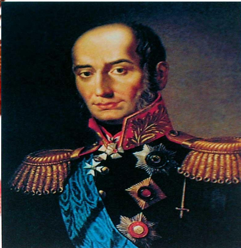
М.Б. Барклай – де-Толли