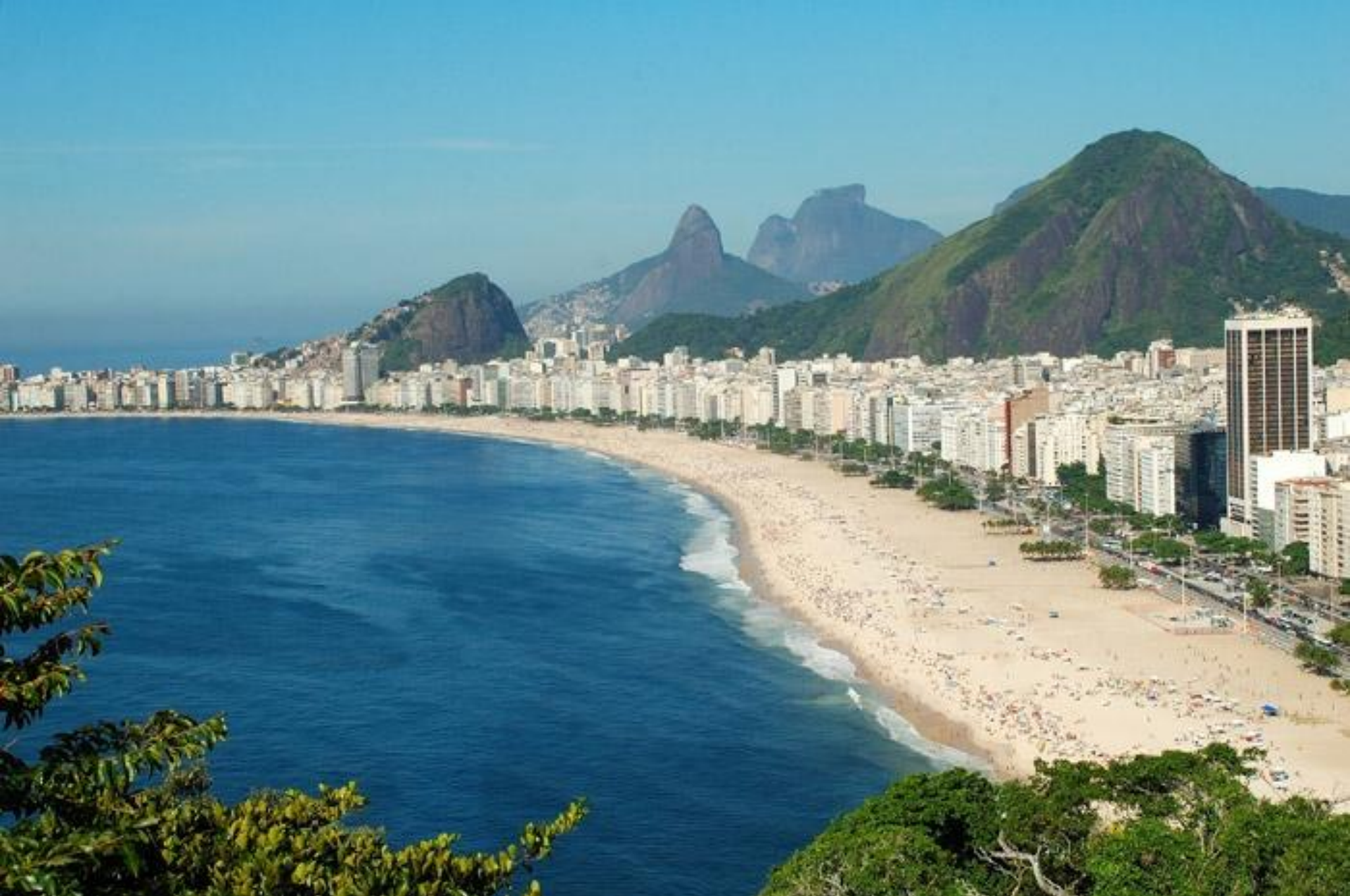
Пляж Копакабана в Рио