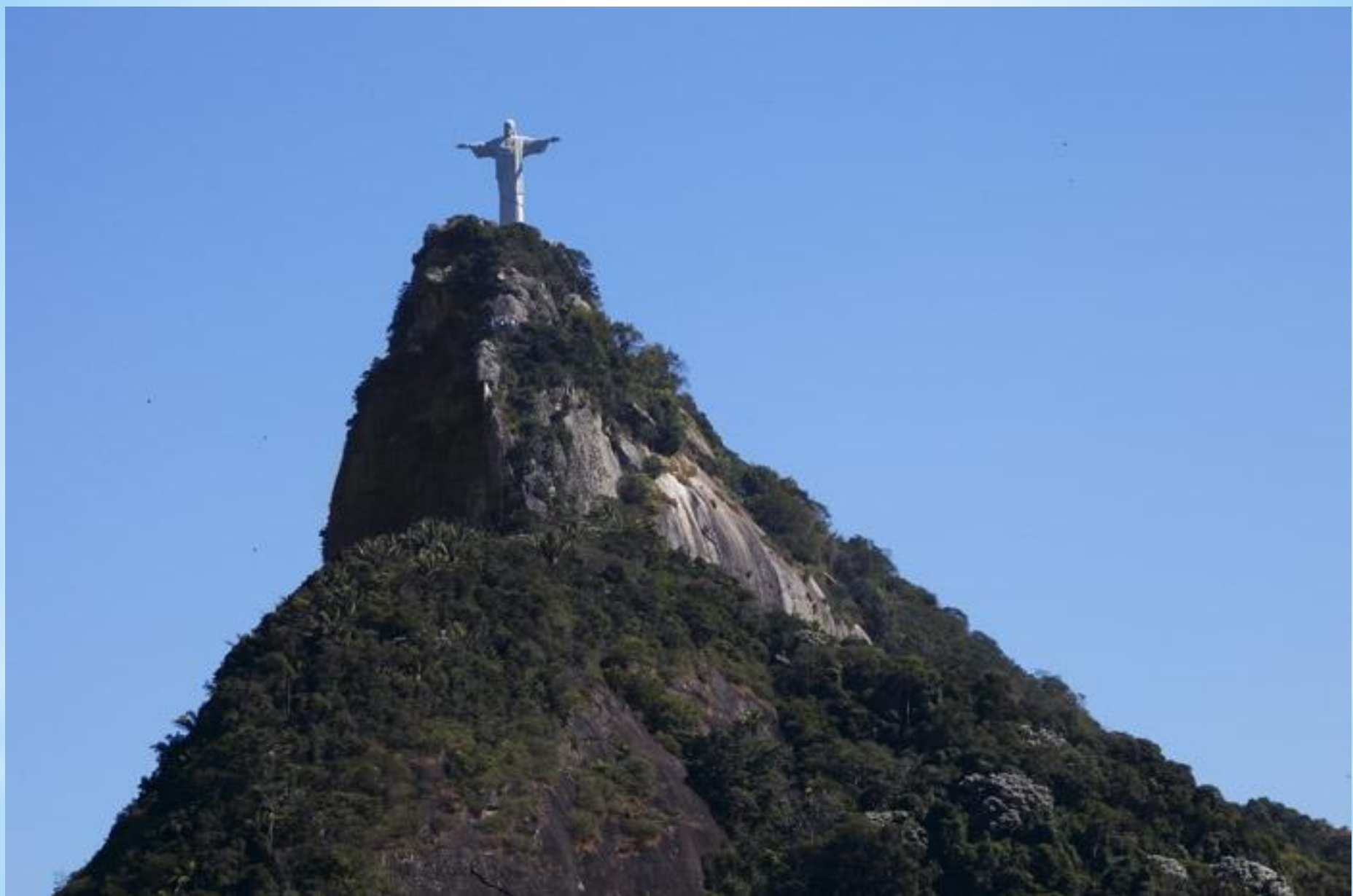
Гора Корковаду і Статуя Христа Спасителя