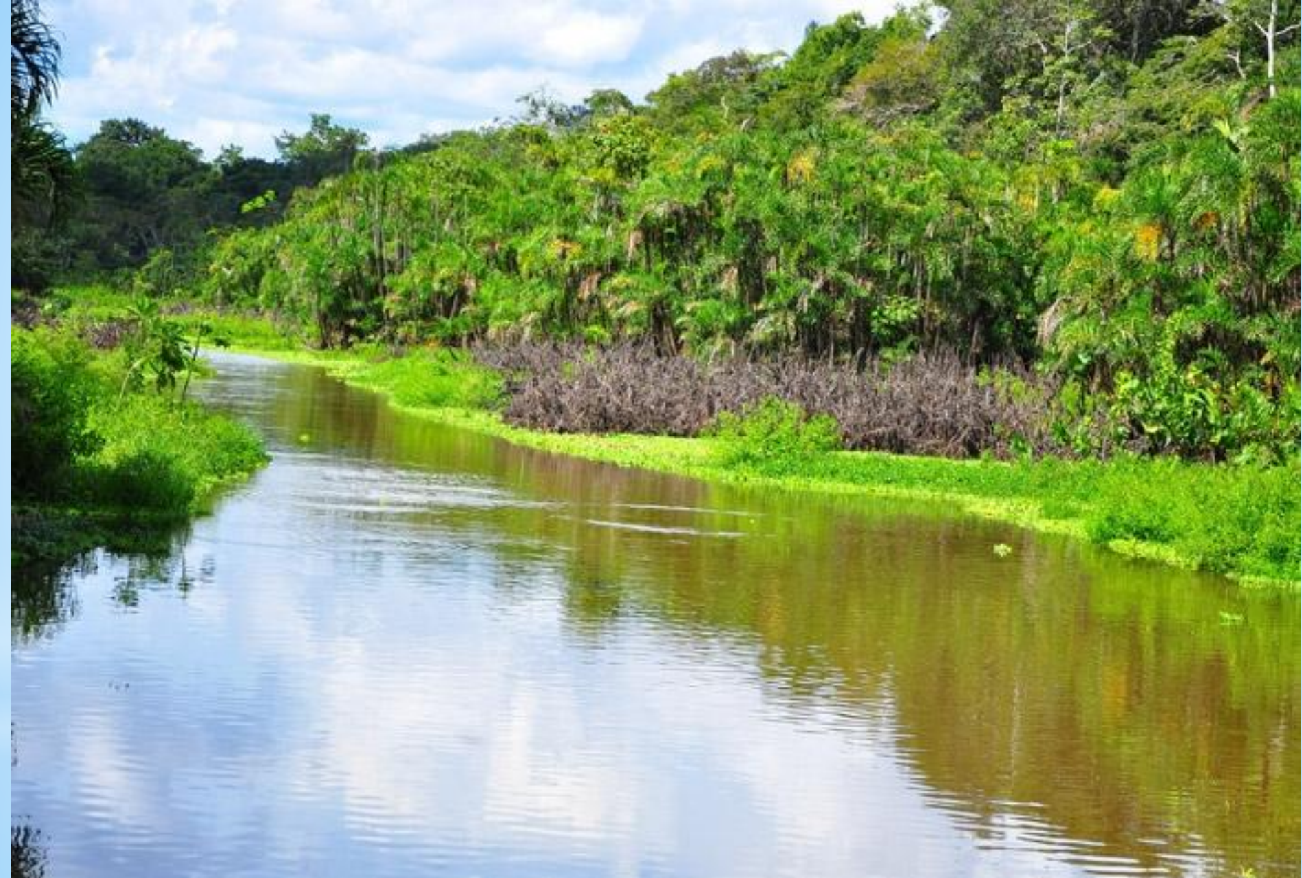
Тропічні ліси річки Амазонка