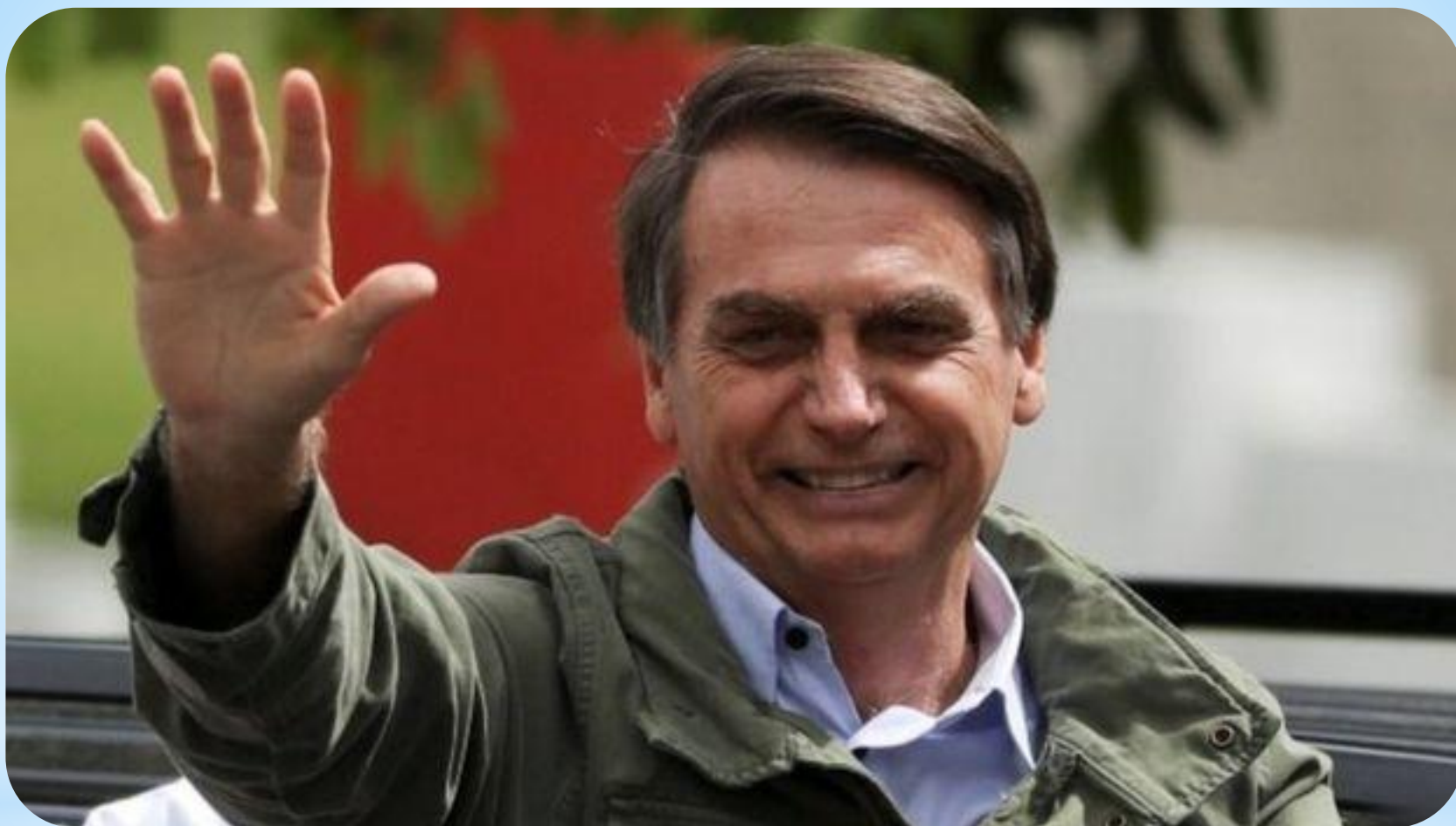
Жаїр Болсонару Президент Бразилії