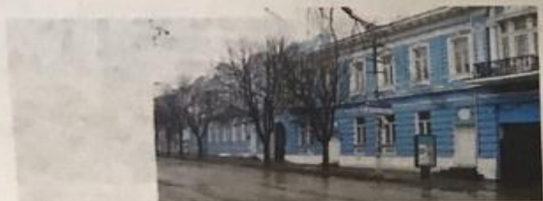
Дом Ш.В. Дувана

Дом Ш.В. Дувана ныне факультет иностранных языков ТНУ.