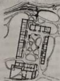
Усадьба Палласа в г. Симферополе. Генеральный план: 1 - жилой дом; 2 - каретный сарай; 3 - колодезь; 4 - конюшней сарай.

В архитектуре зданий были использованы элементы мавританского стиля, поэтому они напоминают постройки Бахчисарайского дворца. Усадьбу Паллас назвал в честь жены «Каролиновкой». Каролина Ивановна после разрыва с мужем прожила в имении до своей смерти. Сохранились расположенные по периметру двора жилой дом, два флигеля, каретный сарай с конюшней и колодец, обложенный штучным камнем.