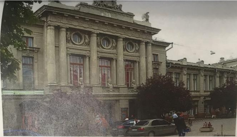
Русский драматический театр им. Горького (ул. Пушкина, 15)

Бывшее здание дворянского театра было построено в рекордно короткие сроки в 1821 г. купцом Волковым. Здание является объектом культурного наследия народов России регионального значения и одним из старейших театров страны.