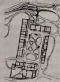
Усадьба Палласа в г. Симферополе. Генеральный план: 1 - жилой дом; 2 - каретный сарай; 3 - колодезь; 4 - конюшней сарай.

В архитектуре зданий были использованы элементы мавританского стиля, поэтому они напоминают постройки Бахчисарайского дворца. Усадьбу Паллас назвал в честь жены «Каролиновкой». Каролина Ивановна после разрыва с мужем прожила в имении до своей смерти. Сохранились расположенные по периметру двора жилой дом, два флигеля, каретный сарай с конюшней и колодец, обложенный штучным камнем.