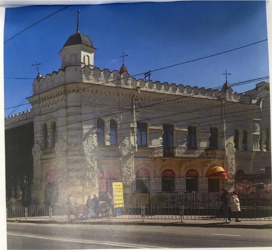
Дом Чирахова (ул. Одесская, 24)

Основное здание современного театра было построено в 1911 г. по проекту академика архитектуры А. Н. Бекетова в стиле неоклассицизма с элементами стиля модерн. Фронтон и портик богато украшены скульптурой, зрительный зал и фойе – лепниной и росписью, мраморные лестницы – бронзовыми скульптурными изображениями рыцарей.