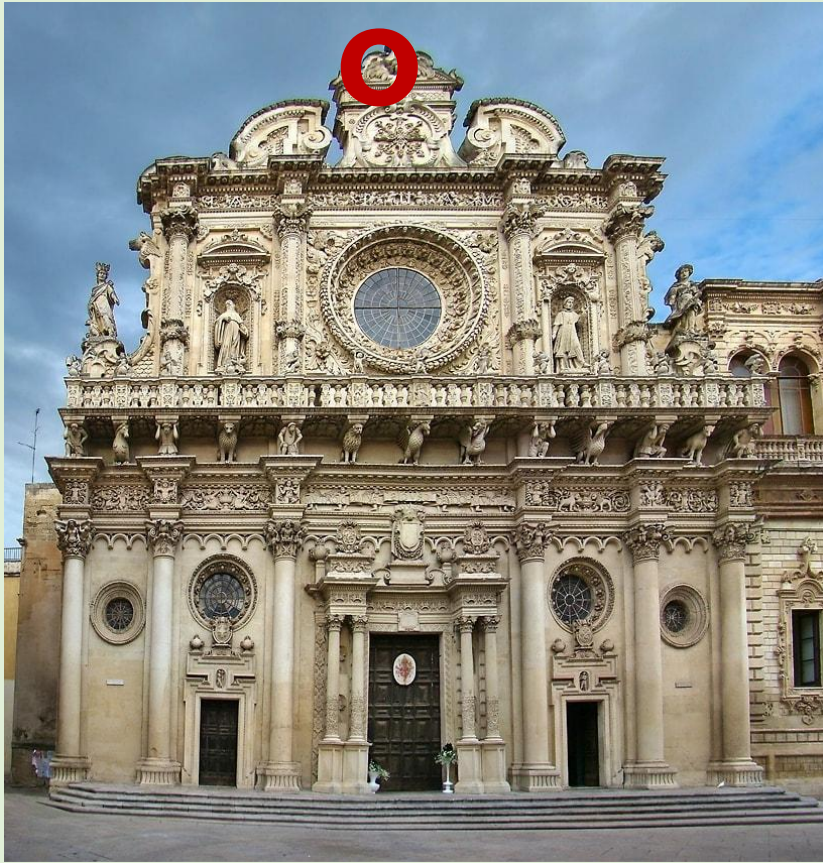
Базилика дель Санта Кроче, Лечче, Италия.