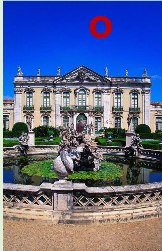
Дворец Келуш. Португалия