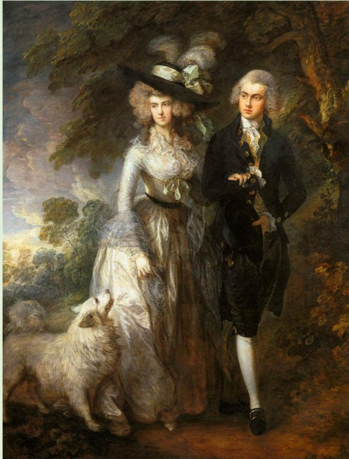
Томас Гейнсборо. Утренняя прогулка

Зарождается личная гигиена. Получают распространение носовые платки, ночные рубашки.