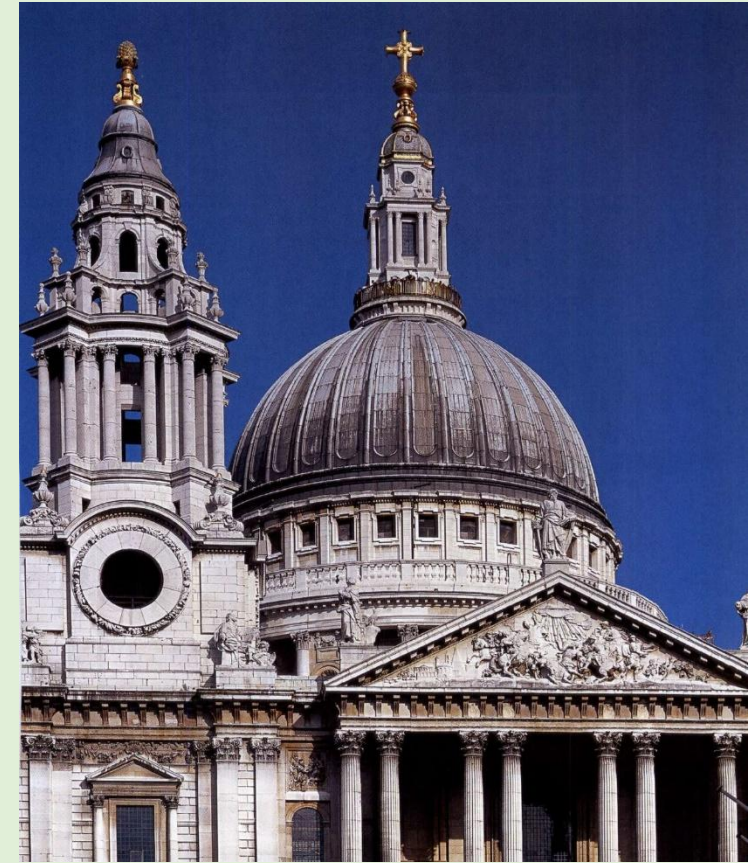
Собор Святого Павла в Лондоне