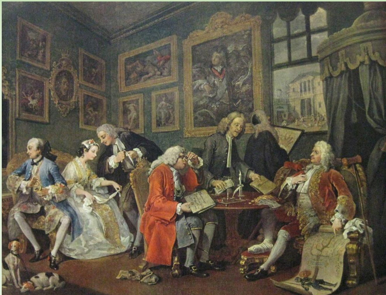
У. Хогарт. Модный брак.

Т В Европе нового времени в брак вступали довольно поздно. В среднем, в XVIII веке мужчинам было 28-29 лет, женщинам 25-26 лет. В состоятельных буржуазных семьях женились раньше, в дворянских еще раньше, там невесте могло быть 18 а жениху 21.