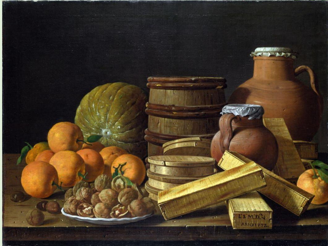
Мелендес Луис Эгидио

Для бедных слоев населения основу питания составляли зерновые культуры. Богатые люди могли себе позволить молочные продукты. В приморских странах морепродукты. Мясо и рыбу ели в основном в соленом виде. Благодаря колониям на столах появляется сахар, специи, индейка, кофе, шоколад. Начинают выращивать помидоры, фасоль. На Пиренейском полуострове завоевывает прочные позиции кукуруза. К концу XVIII века в общий рацион входит картофель. Хотя введение этого продукта сопровождалось сопротивлением со стороны населения.