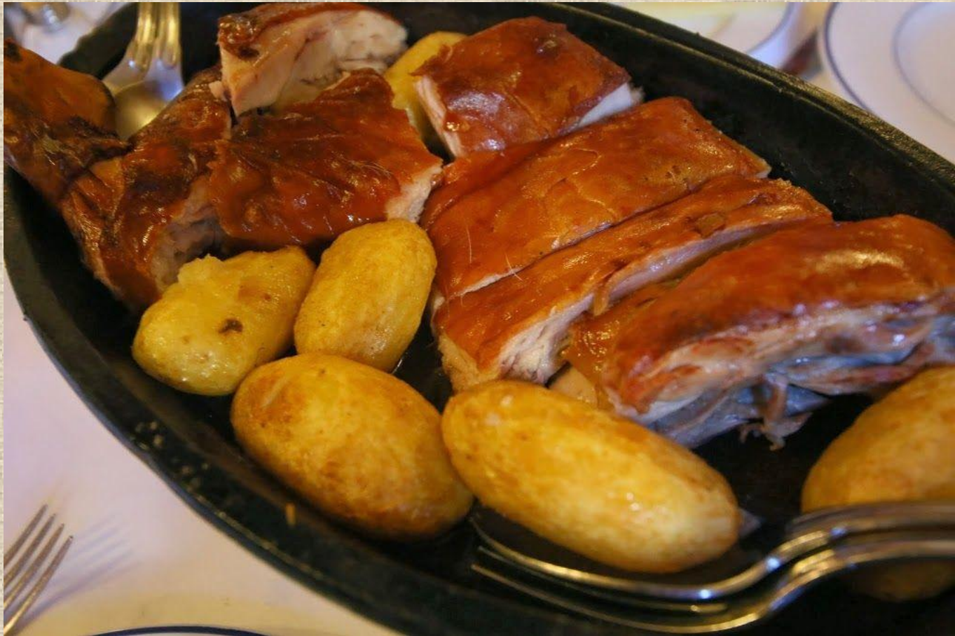
Cochinillo con patatas