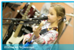
Школа на Черкасова