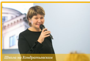
Школа на Кондратьевском

ГОСУДАРСТВЕННОЕ БЮДЖЕТНОЕ ОБЩЕОБРАЗОВАТЕЛЬНОЕ УЧРЕЖДЕНИЕ СРЕДНЯЯ ОБЩЕОБРАЗОВАТЕЛЬНАЯ ШКОЛА № 619 КАЛИНИНСКОГО РАЙОНА САНКТ-ПЕТЕРБУРГА