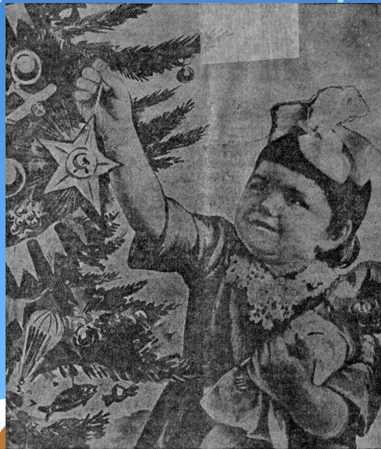
У новогодней елки. Фотокомпозиция Б. Филиппенно и Р. Бертрам.

Январь 1941 года был еще мирным временем для жителей Куйбышева. Для детей проводили елки. В Куйбышевском театре оперы и балета показывали четыре спектакля: «Иван Сусанин», «Кармен», «Фауст» и «Лебединое озеро». Для школьников проводили спортивные соревнования.