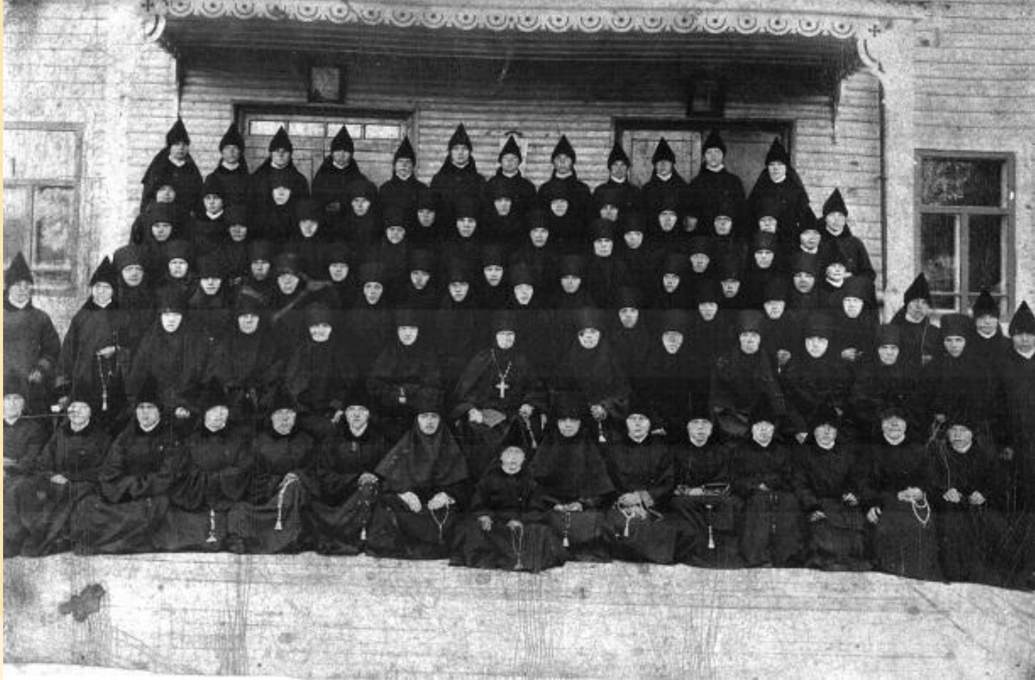
Сестры-основательницы монастыря.