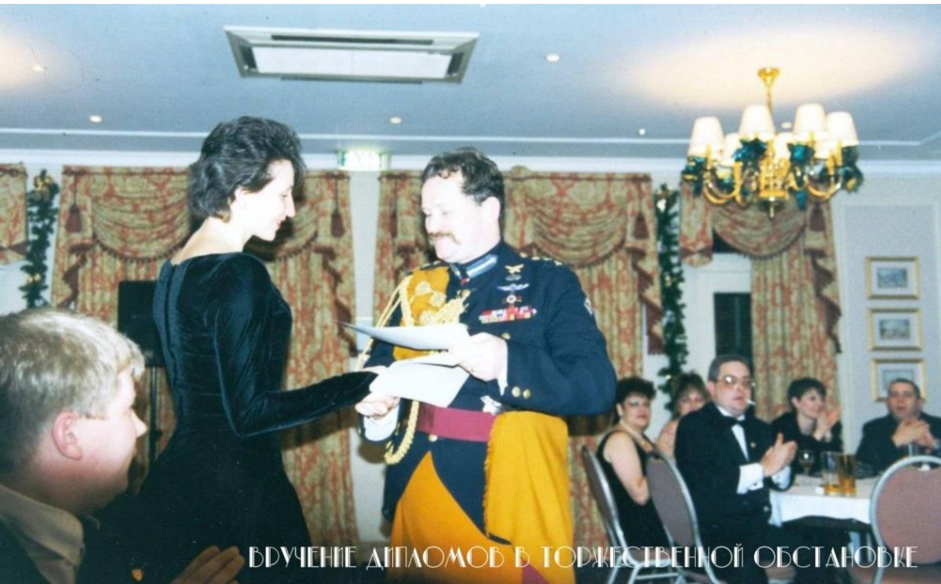
ВРУЧЕНИЕ ДИПЛОМОВ В ТОРЖЕСТВЕННОЙ ОБСТАНОВКЕ