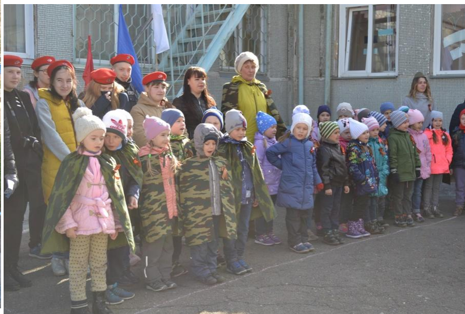
Торжественное открытие военно-патриотической игры «Зарничка»