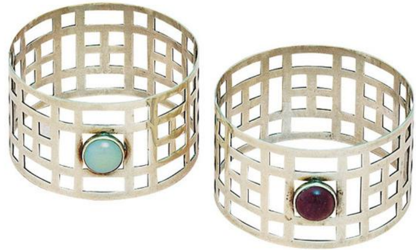
Кольца для салфеток, серебро, аметисты, 1905 год