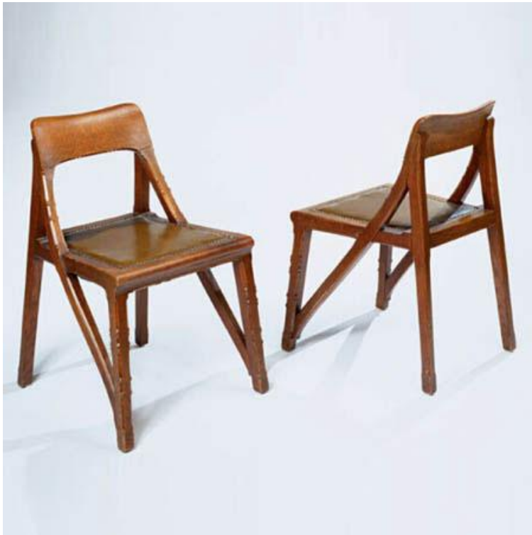
Стул, дуб массив, кожа, 1899 г.