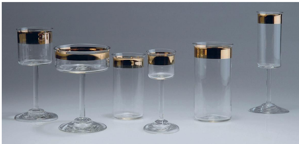
Набор бокалов и рюмок. 1902.