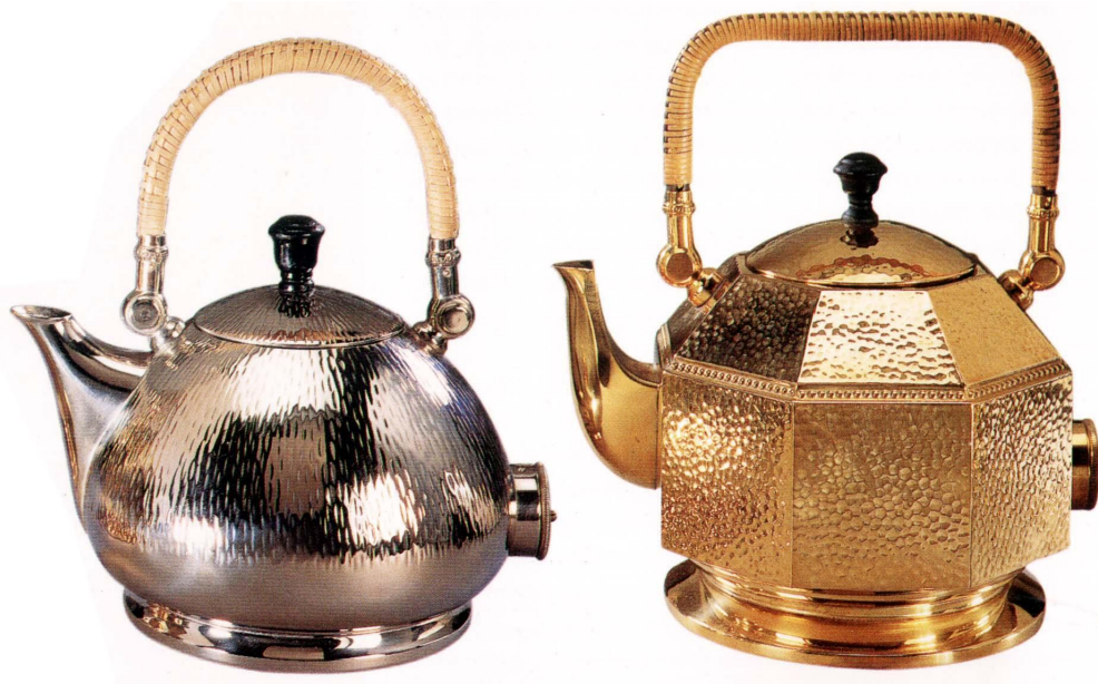
Чайники AEG 1909г.