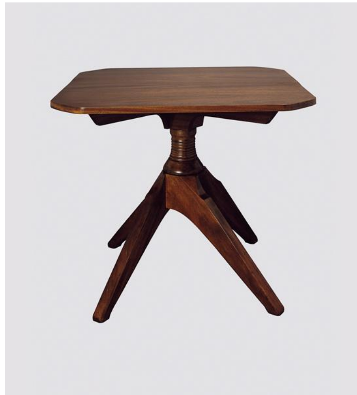
Стол-пропеллер, 1905 г.