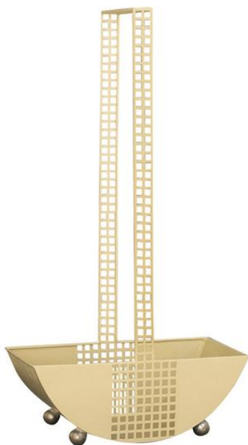
Корзина, выпускаемая «Венскими мастерскими» с 1903 по 1932