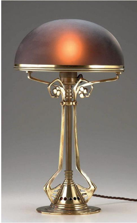
Настольный светильник. 1905