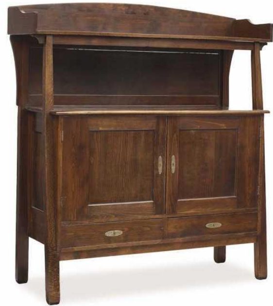
Буфет, бук, 1900 г.