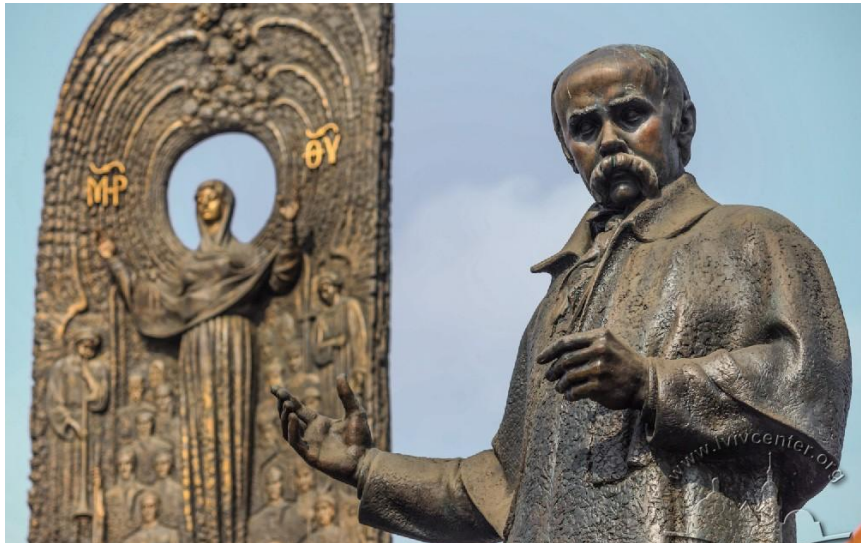
ПАМ'ЯТНИК ТАРАСУ ШЕВЧЕНКО У ЛЬВОВІ