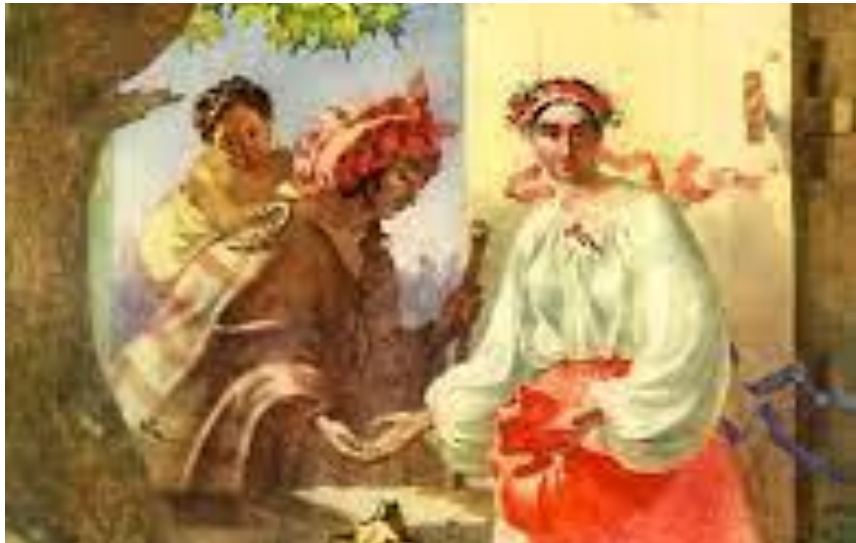
Текст Циганка-ворожка (1941)