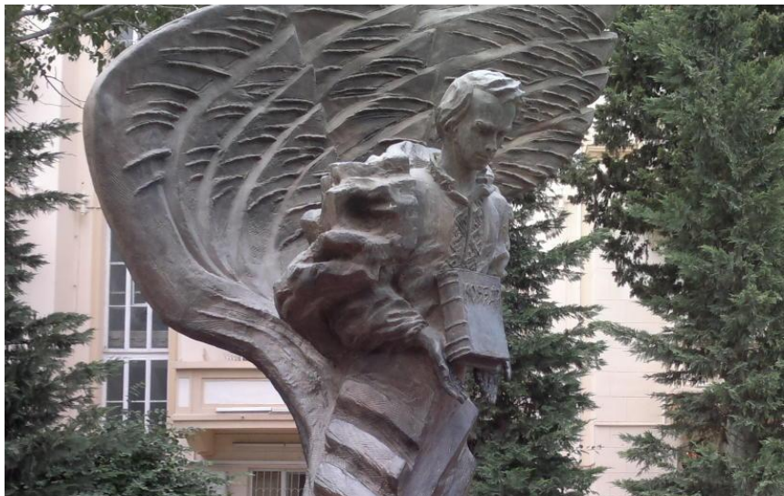
ПАМ'ЯТНИК ТАРАСУ ШЕВЧЕНКО В БАКУ