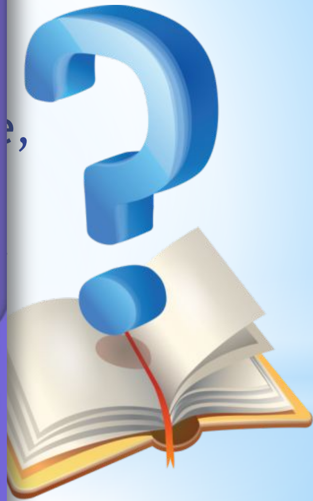
Рисунок Леры Ярославской