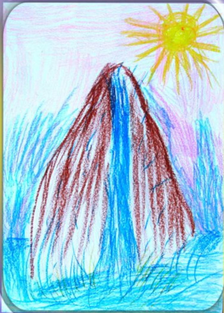
Рисунок Ульяны Щепиловой