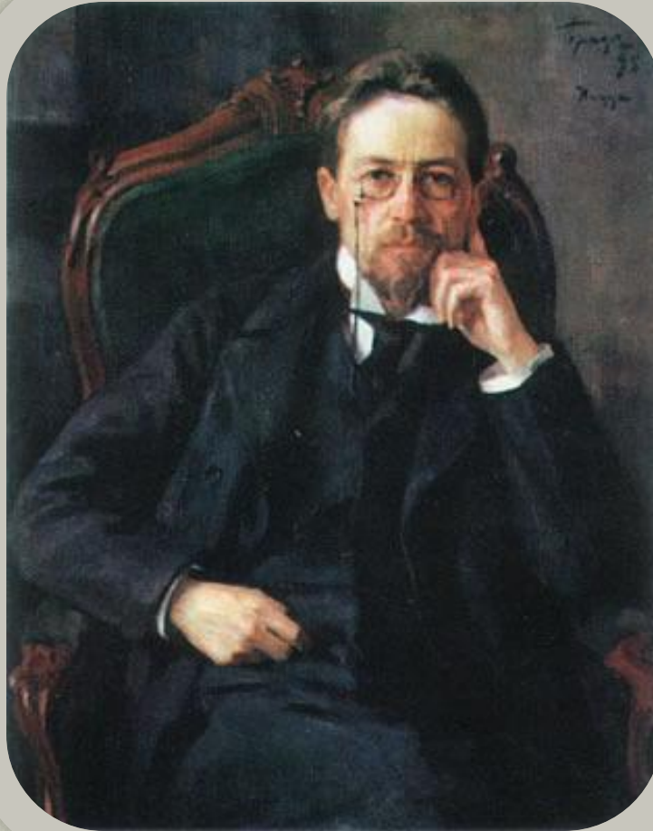
АНТОН ПАРВЛОВИЧ ЧЕХОВ 1860 -1904