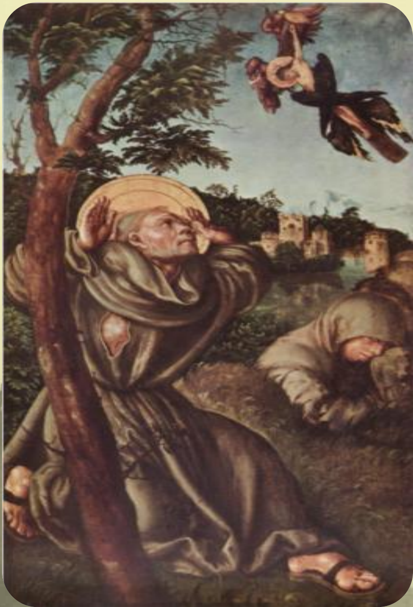
«Стигматизация св. Франциска» 1502

Стигматизация, появление на теле знаков, подобных оставшимся на теле распятого Христа, от креста, гвоздей, венца.