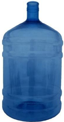
Бутылк а (бутыл ь)