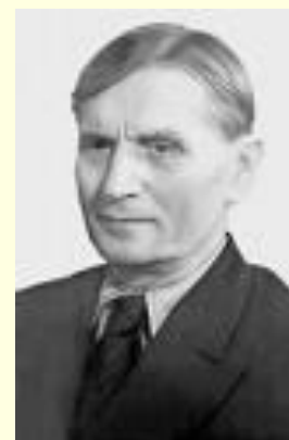
Т. Д. Лысенко