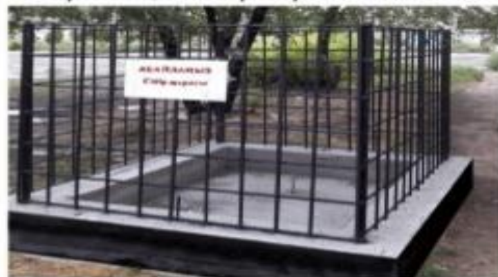
Үшқайық ауыл округі 102 квартал 209 телімінде орналасқан “Сібір жарасы” ошағы