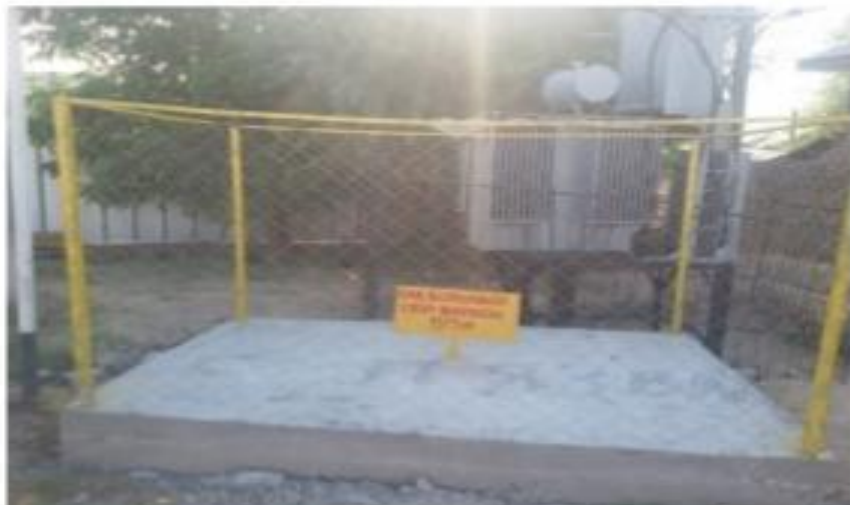
Түркістан қаласы Қазыбек би көшесі №213 телімде орналасқан "Сібір жарасы" ошағы